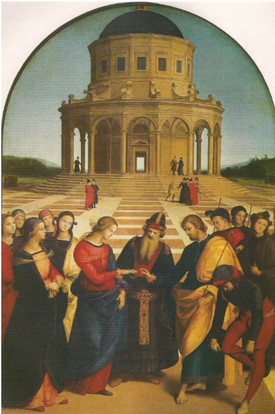
(Raffael, Die Vermählung der Jungfrau Maria )

Und die Legenden von ihrer Kindheit wollen dartun, daß sie den Anforderungen ihrer Erzieher von früh auf nicht nur mit williger Bereitschaft, sondern sogar mit einem erstaunlich zielbewußten eigenen Eifer entgegenkam.