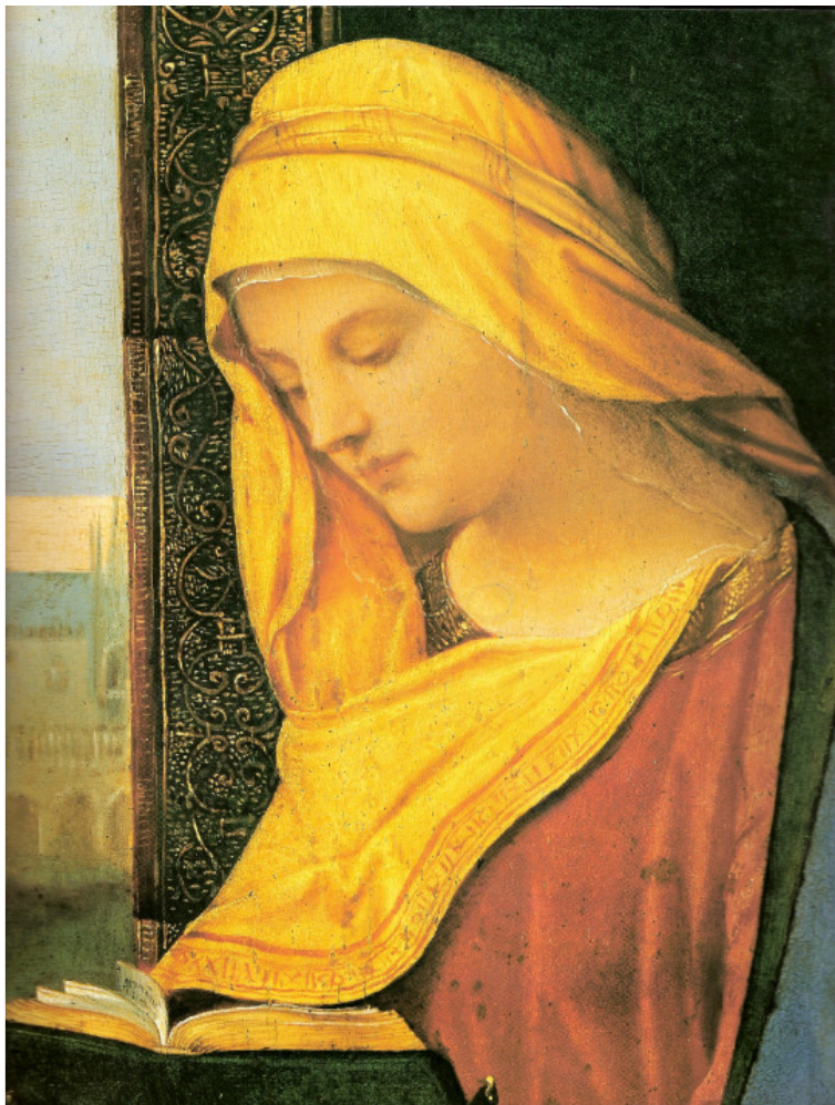
(Giorgione, Lesende Maria [Ausschnitt])

Die lukanische Maria steht wie ein himmlisches Bild vor unserer Seele. Ihr kurzes Leben hat, von außen gesehen, etwas Schicksalloses, Überirdisch-Ruhevolles und Undramatisches. Bei ihr ist das innere Wesen wichtiger als das äußere Schicksal. Der Himmel scheint sie in die aufgeregten Strudel und Wirren der Erdenschicksale hineingesandt zu haben, um den Sturm zu beschwichtigen und durch sie Möglichkeiten zu begründen, die sich aus den Gesetzmäßigkeiten des irdischen Daseins allein nicht ergeben. So sind es nicht die Dramatiker und Erzähler, sondern die Maler gewesen, die ihr Wesen darzustellen unternommen haben.