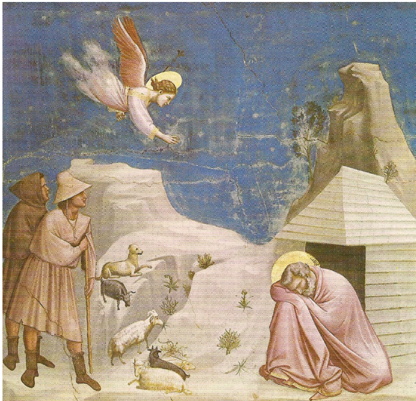
(Giotto, Der Traum des Joachim , Padua)

Die außerbiblischen Überlieferungen über Geburt und Kindheit dieser Maria , die in reicher Fülle in den apokryphen Evangelien und den mittelalterlichen Legenden einen Niederschlag gefunden haben, schildern uns eingehend das Wesen und Leben der Eltern. Wir werden nach Jerusalem versetzt, in die Stadt, die eine Konzentration alles dessen darstellt, was in der Menschheit alt und reif geworden ist. Zu zwei bereits betagten Menschen werden wir geführt, die beide einem vornehmen Geschlecht entstammen. Sie haben sich ihr ganzes Leben hindurch der treuen Pflege und Einhaltung des Gesetzes und der väterlichen Frömmigkeit hingegeben, aber zu ihrem großen Schmerz ist ihnen kein Kind geboren worden.