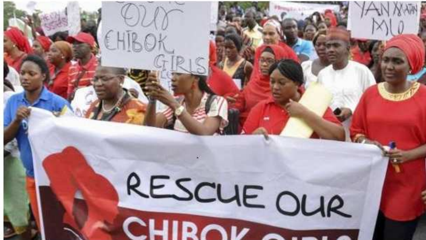
Auf einer Demonstration in Abuja wird die Regierung zur Befreiung der Mädchen aufgefordert.