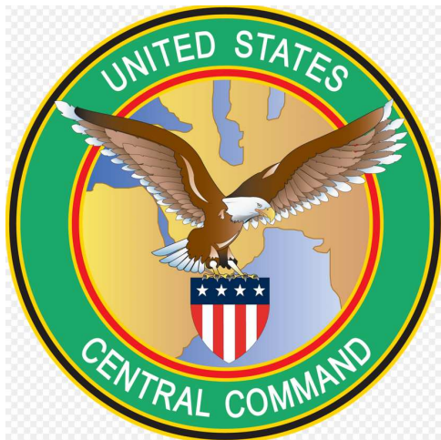
(Emblem des CENTCOM, Zentralkommando der Vereinigten Staaten)

In Syrien ist die Einmischung (der USA) noch perfider (als im Irak): mit noch mehr Waffen zu versorgende "moderate Rebellen Gruppen" sollen diesen Job zur Eliminierung der "I.S.-Banden" erledigen und den wieder ins Amt gewählten syrischen Präsidenten zu Fall bringen.