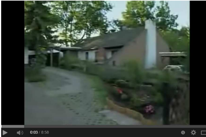
KURDEN Heroin, Waffen, Immobilien Die schmutzigen Geschäfte der PKK in Deutschland Panorama 14

Zu den Kurden 12 in der Türkei, PKK (s.o.): 13 Die Arbeiterpartei Kurdistans (Eigenbezeichnung: Partiya Karkeren Kurdistan, Abk.: PKK) ist eine kurdische, marxistisch ausgerichtete Untergrundorganisation mit Ursprung in den kurdischen Siedlungsgebieten innerhalb der Türkei ... Die Organisation (PKK) und ihre Nachfolger werden unter anderem von der Türkei, der EU und den USA als terroristische Vereinigung eingestuft. (Das kann man natürlich auch mit der Türkei, EU und den USA machen.) Über die PKK bei uns heißt