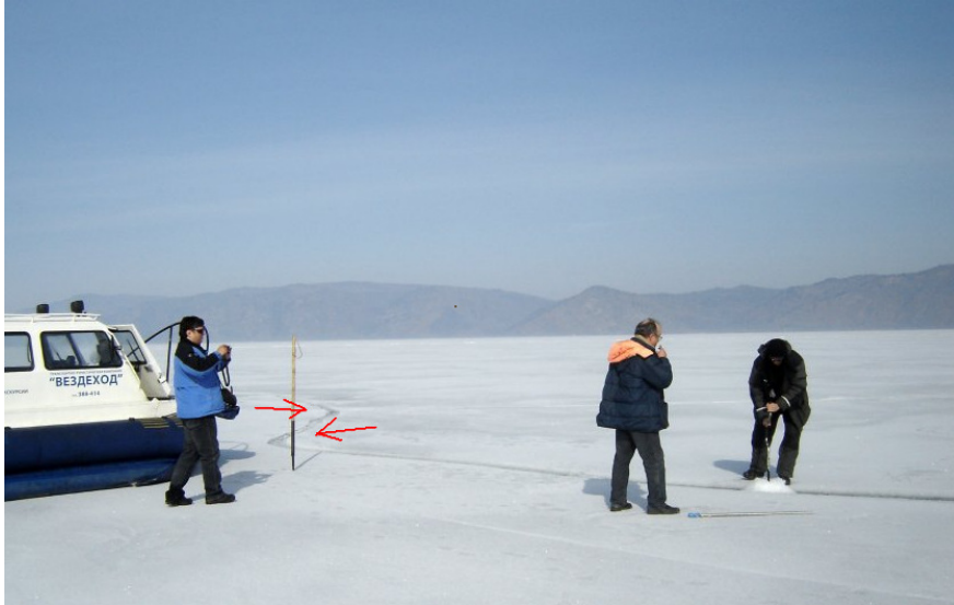
(Text zu Bild 8: Ursachenforschung: Russische Wissenschaftler bohren Löcher in Eiskreise, um das Naturphänomen zu studieren.)

Um dem Spiegel- „Eiskreis“ auf dem Grund zu gehen, bergen die so genannten Russische Wissenschaftler Medien-wirksam einen so genannten Verräterischen Kern :