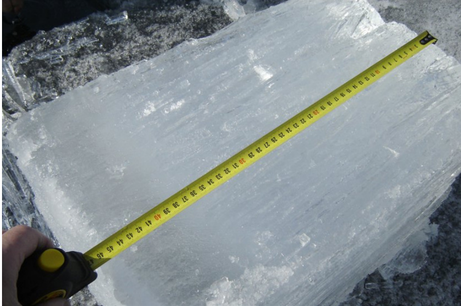
(Text zu Bild 10: Beobachtung: Der Eiskreis ist durchzogen von winzigen Rissen – Gaseruptionen lassen die Eisdecke langsam schmelzen.)

Im Übrigen ist dieser Spiegel -Artikel auch auf