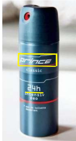
( prince -Deodorant der Firma your own brand GmbH)