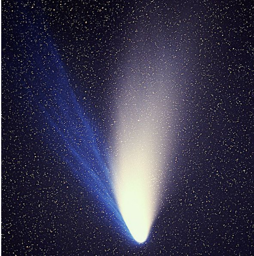
(Der Komet Hale-Bopp, 7. April 1997)