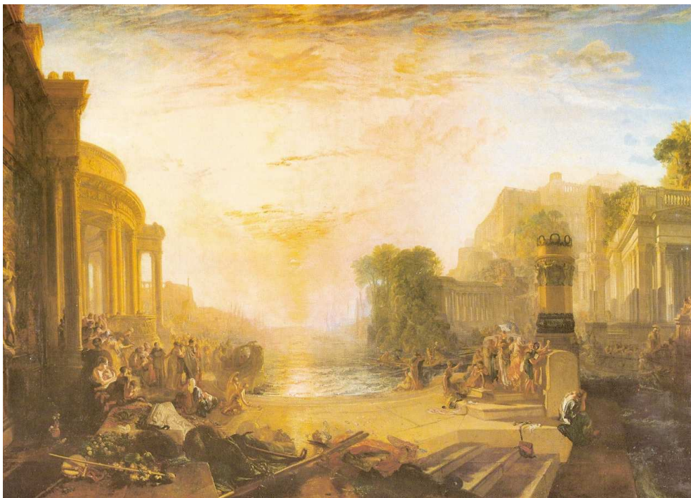
(W. Turner, The decline of Carthago Empire [“Der Untergang des Karthago-Reiches”])

Abschließend noch der Musikvideo-Hinweis und ein Bild: www.youtube.com 10