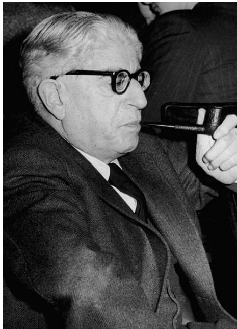
Ernst Simon Bloch (1885-1977)

Sein Hauptwerk Das Prinzip Hoffnung schrieb er zwischen 1938 und 1947 im US-amerikanischen Exil. Darin bekennt sich Bloch zum Marxismus als einer „Zukunftswissenschaft“: „Die dialektisch-historische Tendenzwissenschaft Marxismus ist derart die vermittelte Zukunftswissenschaft der Wirklichkeit plus der objektiv-realen Möglichkeit in ihr; all das zum Zweck der Handlung (S. 331) 21 , usw., usw.