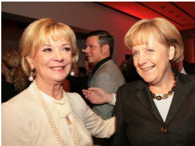
(Freundinnen Liz Mohn und Angela Merkel)