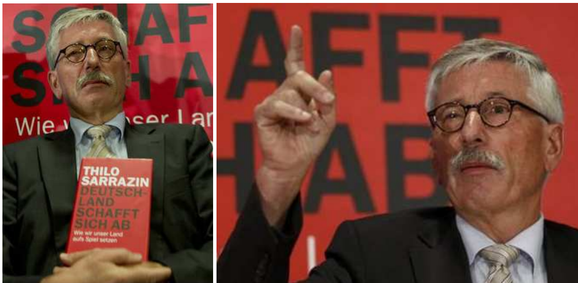
(Thilo Sarrazin, geb. 1945, mit seinem Buch Deutschland schafft sich ab )

Die Thilo-Sarrazin-Aufmachung, die plötzliche Popularität, die emotional geführte Diskussion, die Logenzeichen, der „Bestseller“ 4 , die „Absetzung“ Sarrazins – all dies „füllt das Spätsommer-Loch“.