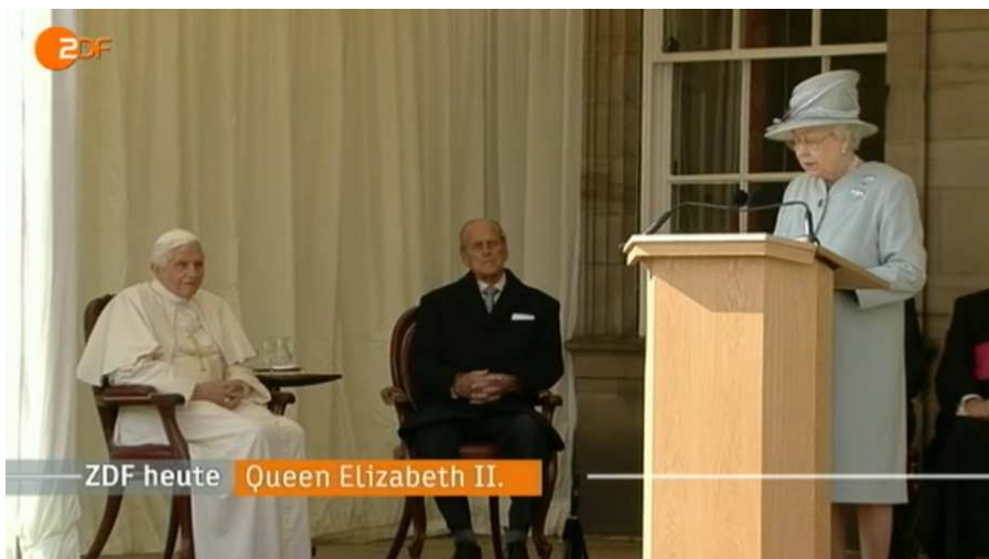
(ZDF-Sprecherin, s.o.: Der Papst und die Queen – eine Begegnung zweier Staats- und Kirchenoberhäupter . In der Mitte sitzt Prinz Charles. Über diese „feine Gesellschaft“ siehe u.a. Artikel 375-379)

Die Betonung der ZDF-Sprecherin, dass sich vor über 400 Jahren der englische König Heinrich VIII. von der katholischen Kirche losgesagt und die anglikanische Kirche (mit dem englischen König/Königin als Oberhaupt) gegründet hatte 10 , soll über die „Neue Weltordnung“ hinwegtäuschen .