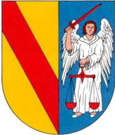
(Wappen von Schopfheim)

Mutter Elisabeth /Isabeau muss daher als anti-michaelisch bezeichnet werden.