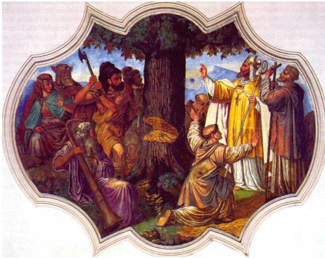
(Bonifatius lässt die Donareiche fällen - Fresko von Alois Dirnberger in der Martinskirche in Westenhofen [Schliersee])