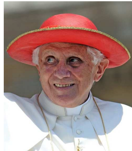
(Papst Benedikt XVI. )

Kommen wir zur Zahlen- bzw. Bildsymbolik des okkulten Verbrechens von Lörrach (u.a. aus Artikel 386-391):