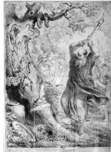
(Bonifatius fällt die Donareiche, Radierung von B. Rode, 1781)