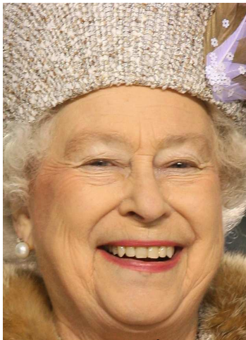
(Queen Elisabeth II. 2 )