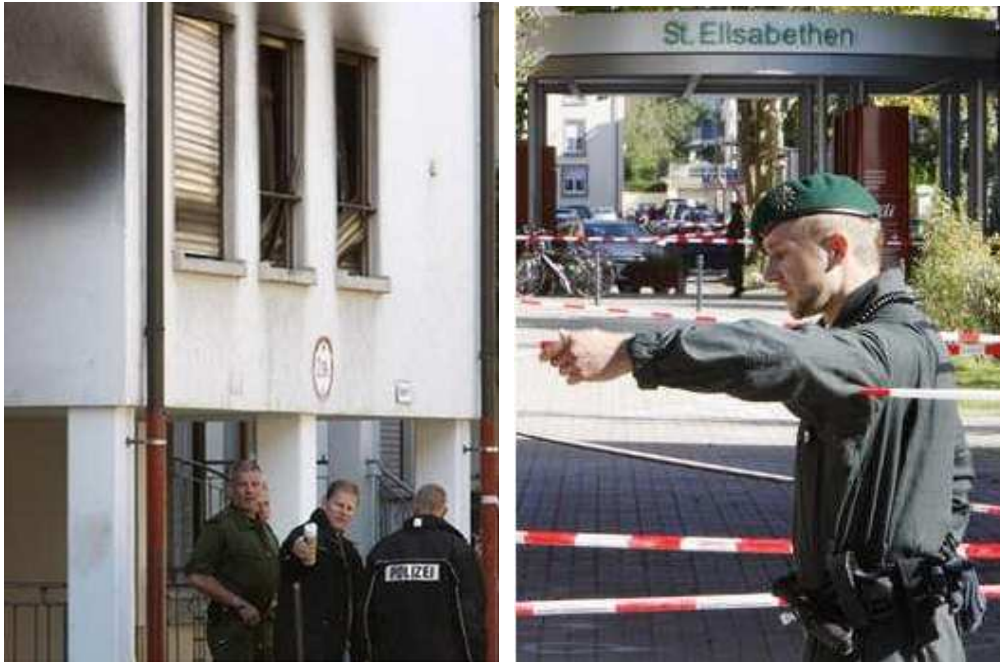
(Die schwarz gekleideten Polizisten sehen nach SEK-Polizisten aus)

Einsatzkommando“?). Es ist davon auszugehen, dass die SEK – wie andere „Amokläufe“ auch 32 – das okkulte Verbrechen von Lörrach für Übungszwecke benutzte.