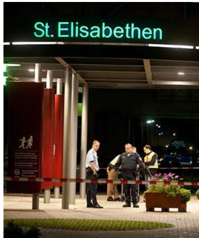
(St. Elisabethen -Krankenhaus in Lörrach)