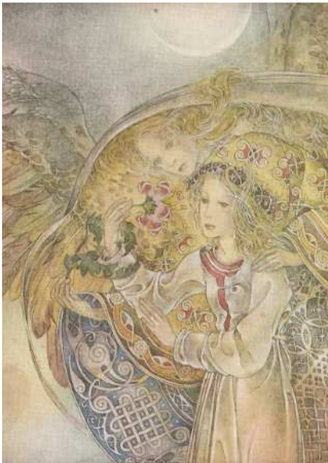
(Sulamith Wülfig, Die Mondsichel )

G. F. Händel, Lascia ch'io pianga (Rinaldo) - R. Invernizzi - Arion Consort - Ghislieri 10