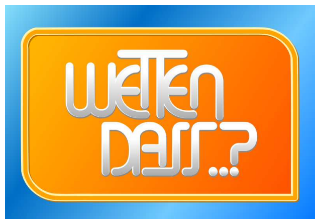
(Wetten, dass ...?-Emblem)

Nach dem dramatischen Unfall in der Live-Show von .. Wetten, dass..!?!". tritt Moderator Thomas Gottschalk (60) um 21.13 Uhr vor die Kameras und verkündete den ( erstmaligen ) 5 Abbruch der Sendung 6 .