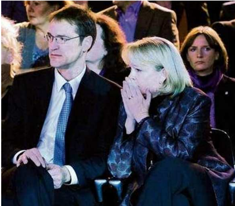
(Geschockte Hannelore Kraft mit „Gebetsgeste“ [vgl. Artikel 459, S. 3/4])

NRW-Ministerpräsidentin Hannelore Kraft, deren Sohn bei der „Love-Parade“ in Duisburg 14 dabei war, war als Zuschauerin zugegen: