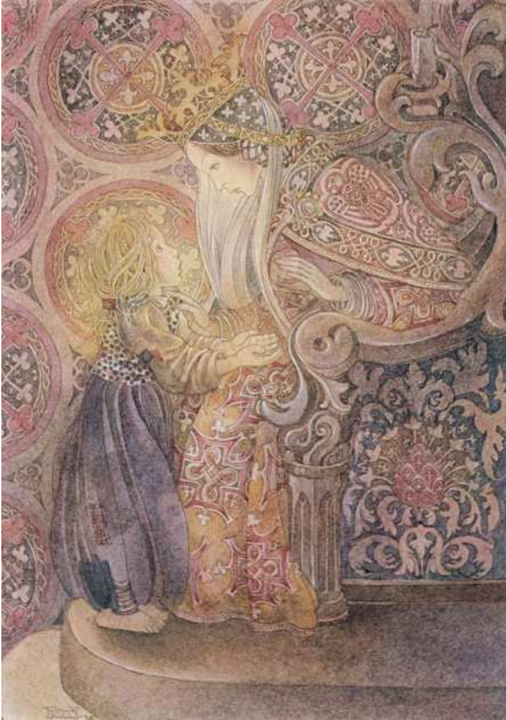
(Sulamith Wülfing, Vom Wunder der Tränen , 1938)