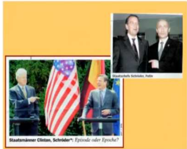
(Kohl und Schröder mit dem Freimaurer-Händedruck) (Clinton und Schröder. Schröder und Putin [mit Finger])