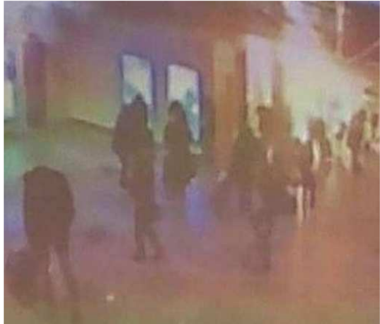
Dieses Bild der Flughafen-Überwachungskamera zeigt den Moment, an dem die Bombe explodiert (ebenda)

Allein das Datum: 24. 1. 2011 und die Uhrzeit: 16:32 (Ortszeit) wären ein Hinweis auf die allorts aktive 3 „Internationale Killerorganisation“ 4 der Geheimdienste (IKOCIAM 5 ), denn: