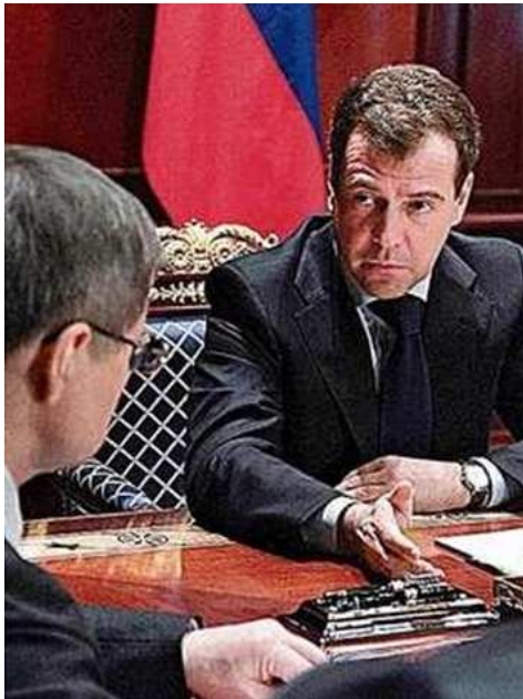
Präsident Dimitri Medwedew (45) in seiner TV-Ansprache nach dem Verbrechen 2

Am letzten Montag erfolgte ein schrecklicher Terrorakt (durch wen?) im Moskauer Flughafen Domodedowo.