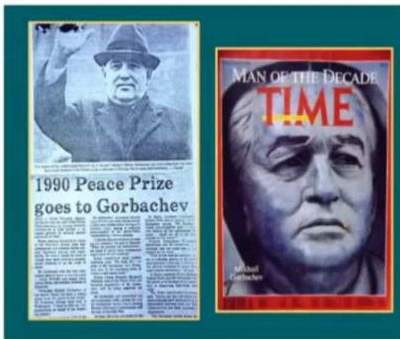
(Text: 1990 Friedensnobelpreis geht an Gorbatschow. Mann des Jahrzehnts)