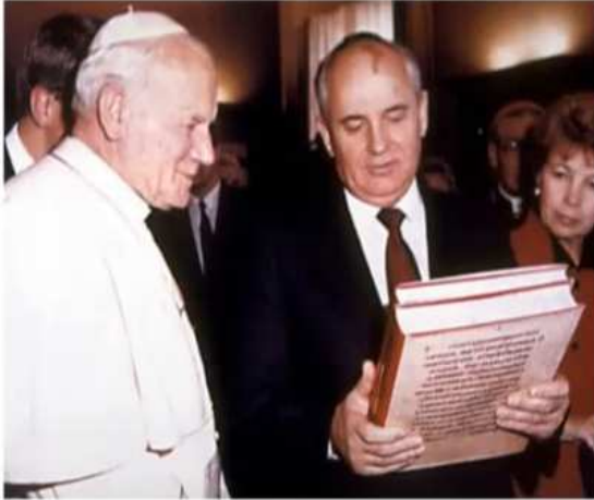
(Papst Johannes Paul II. und M. Gorbatschow)