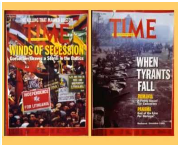
(Text: Abspaltungsbewegungen. Wenn Tyrannen fallen)

... Die Tyrannen, die konnten beseitigt werden – sie waren ja eigentlich alles Freimaurer-Figuren , die das Regime so steuerten. Und jetzt sollte diese Antithese fallen und die (NWO-)