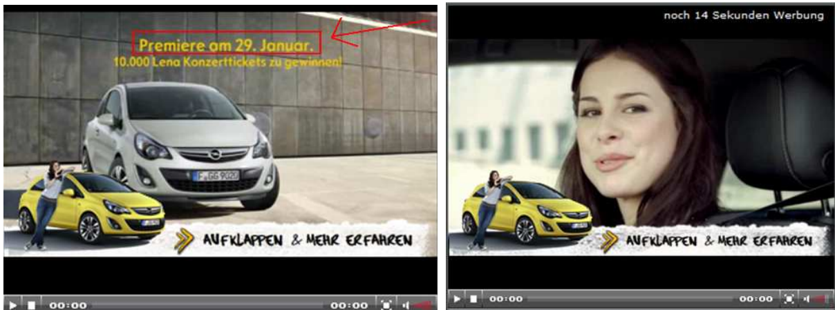
(Lena Meyer Landrut wirbt für den neuen Opel Corsa – Premiere : 29. 1. 2011)