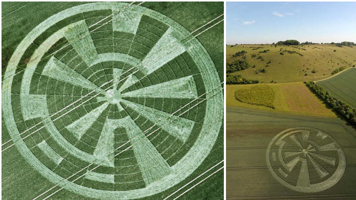
(Gralsmacht-Kornzeichen vom 21. 6. 2010 – “Windrad” – Vale of Pewsey – nahe Oare – Wiltshire – GB)

Johannes Brahms - Violinkonzert D-Dur - 3. Satz 23