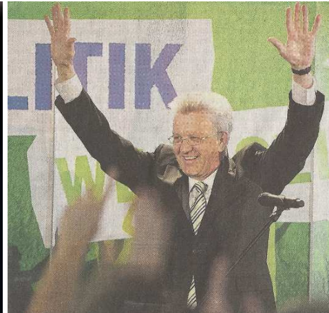
(Benedikt XVI. mit „ Saturno “-Strohhut 15 ) („ Der Triumphator : Grünen-Spitzenkand. Winfried 16 Kretschmann 17 )

Über Kretschmann (s.o.) habe ich am 17. 10. 2010 (in Artikel 408, S. 8, Anm. 70) geschrieben: Auch ist z.B. der Grünen-Landtagsfraktionschef Winfried Kretschmann dem Katholizismus verpflichtet : „Kretschmann, der sich während seines Studiums ab 1973 in der