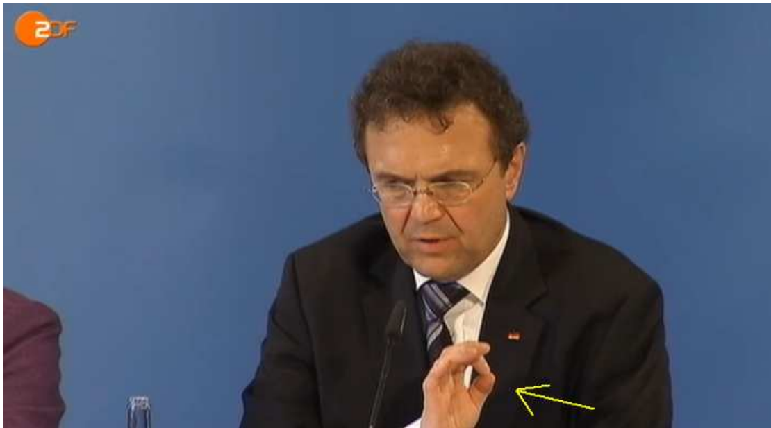
(Innenminister Friedrich bei der Islamkonferenz am 29. 3. 2011. Das Zeichen bedeutet: „Logen-Befehl“)

... Friedrich warb für einen gemeinsamen Kampf gegen den islamischen Extremismus . Manche Teilnehmer verstanden das als Aufruf zum denunzieren. ... Heute drohte der Dialog zu scheitern, weil der Innenminister mit einer sogenannten „Sicherheitspartnerschaft“ viele Muslime gegen sich aufbrachte. Friedrich verteidigte das Ziel als Prävention gegen Terrorismus .