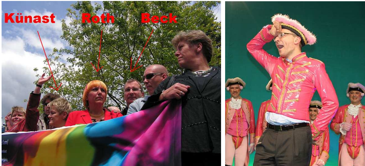
(Li: Die Grünen Künast, Roth und Beck bei einer Homosexuellen-Veranstaltung in Warschau. Re: Volker Beck zusammen mit der schwulen Karnevalstruppe „Rosa Funken“ im Dezember 2006 in Köln 22 )

Über Daniel Cohn-Bendit , Europa-Abgeordneter der Grünen heißt es 23 :