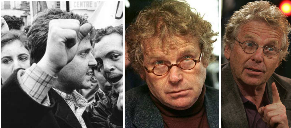
(Daniel Cohn-Bendit, Jahrgang 1945, links mit Kommunistenfaust, usw.)

dem Säuglingsalter, um die junge Generation von ihren hinderlichen Wurzeln durch beschränkte Eltern zu befreien und sie damit als «revolutionäres Potential» für die Gesellschaftsveränderung benutzen zu können.