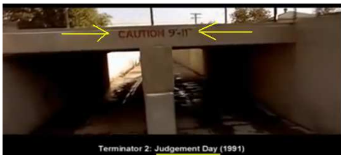
(Film Terminator 2: Judgement Day [dt: „Gerichtstag“] (1991))