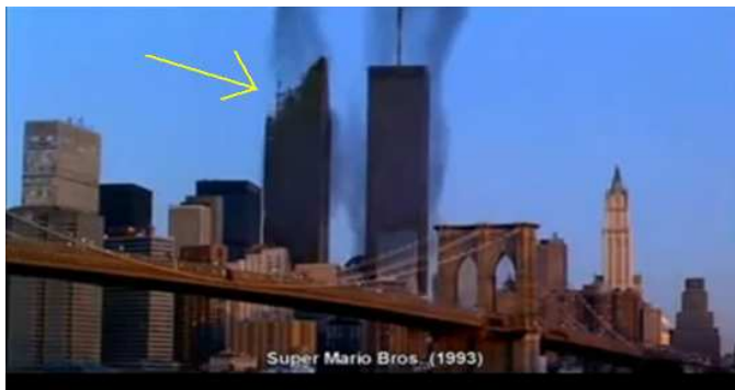
(Film: Super Mario Bros (1993), einstürzender Turm des World Trade Centers in New York)