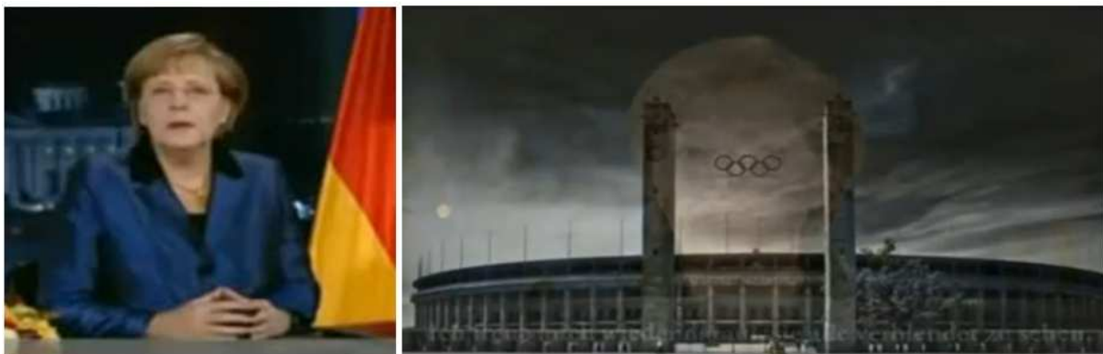
(Aus dem Mega Ritual 2011 -Video: Angie Merkel bei der Neujahrsansprache und das Berliner Olympiastadion)

Wisst ihr schon, welches Ereignis an diesem Tag stattfindet? Wenn nicht, Angie sagt es euch!!! Und bleibt dran, es gibt noch mehr eindeutige (?) Hinweise!!!