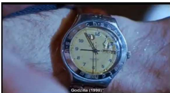
(Film: Godzilla (1998). Kleiner Zeiger: 9, Großer Zeiger: 11. [„9/11“])