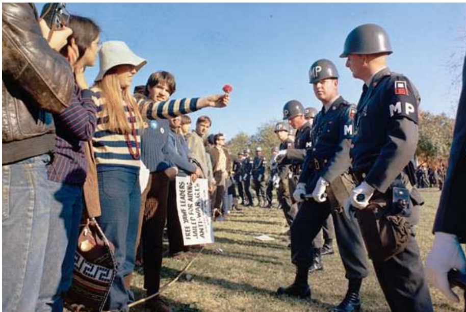
(1968: Demonstration in den USA gegen den Vietnamkrieg)

In US-Militärkreisen kamen Vorschläge auf, den Krieg durch gezielte Landungsoperationen an der nordvietnamesischen Küste der Demilitarisierten Zone (DMZ) zwischen Nord- und Südvietnam, einer weiteren Verschärfung des Luftkrieges und eines breitangelegten Einfalls mit Bodentruppen in Laos und Kambodscha, um den Ho-Chi-Minh-Pfad wirksam zu unterbrechen, letztlich siegreich zu beenden. Der Amtsnachfolger Johnsons, Richard Nixon, lehnte dies angesichts der unkalkulierbaren politischen Konsequenzen ab, zu denen eine mögliche Kriegserklärung und ein militärisches Eingreifen Chinas zählten.