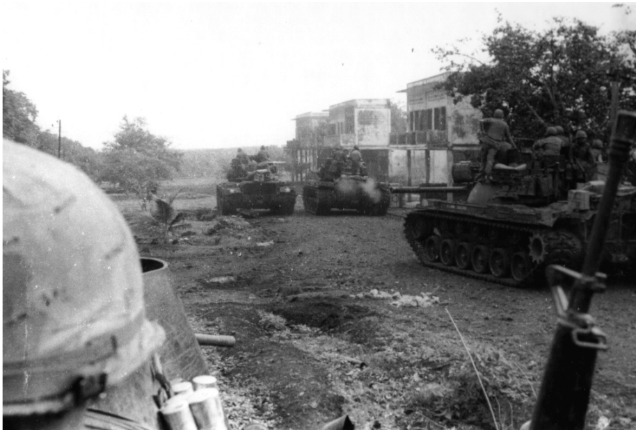
(US-ARVN-Invasion in Kambodscha. Beginn am 25. 4 1970)

Nur wenig später (25. 4. 1970) begann die so genannte Cambodian Campaign („Schlacht von Kambodscha“), auch Cambodian Incursion („Einfall in Kambodscha“) genannt, ein großangelegter Feldzug, der dreizehn einzelne Operationen in Südkambodscha umfasste und hauptsächlich von der ARVN getragen war. Ziel war die Besetzung bzw. Säuberung der FNL-Rückzugsgebiete, die Lokalisierung und Ausschaltung des in diesem Gebiet vermuteten geheimen FNL-Hauptquartiers und die Störung bzw. Unterbrechung des Ho-Chi-Minh-Pfades. Insgesamt marschierten 43.000 Soldaten der ARVN und 31.000 US-Soldaten nach Kambodscha ein.