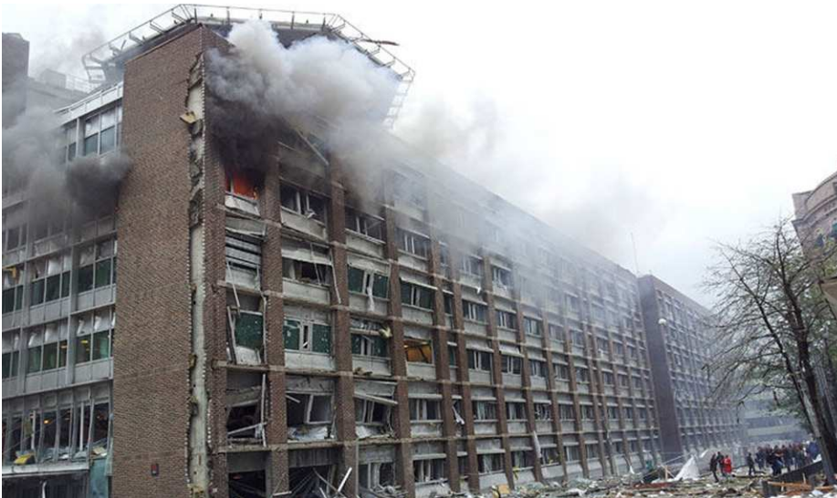
(Ebenfalls von der Explosion getroffen wurde das Ölministerium ... 10)