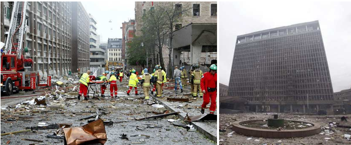
(Li: Wie Im Krieg : Trümmer und Schutt liegen in den Straßen. Retter bahnen sich ihren Weg. 9 Re: Regierungs-Gebäude)