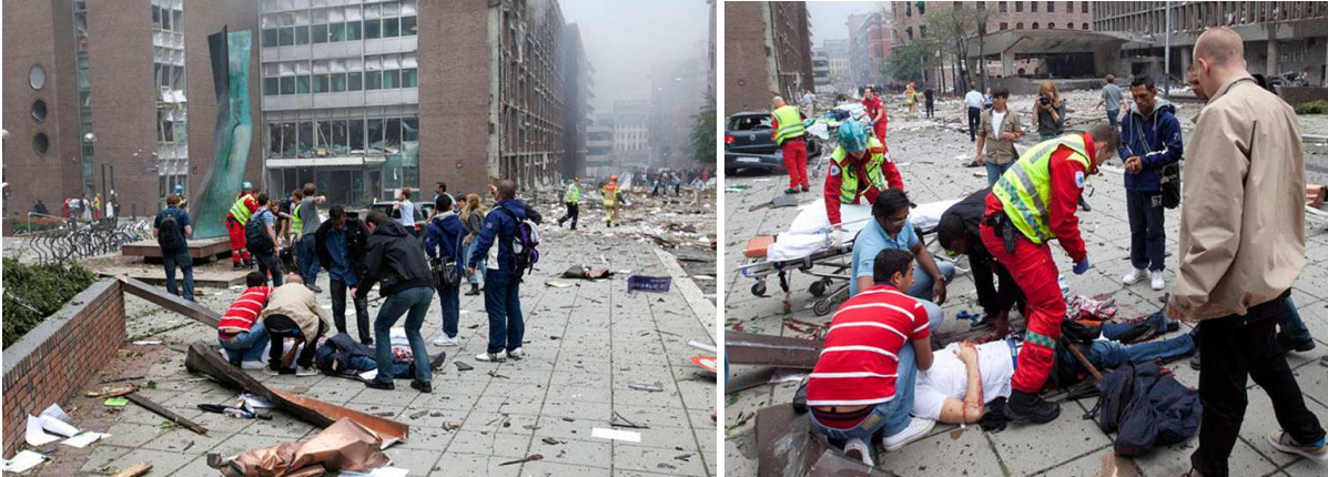
(Li: Augenzeugen sprachen von einer Autobombe . Die Polizei bestätigte einen Sprengsatz . 8)