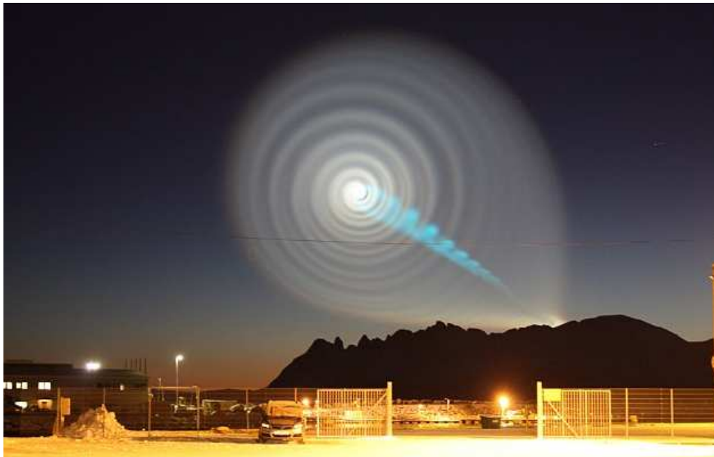
(9. 12. 2009: Himmelsspirale in Norwegen. Siehe Artikel 165)

Julia Fischer & Daniel Muller-Schott - Handel-Halvorsen Passacaglia (HQ) 30