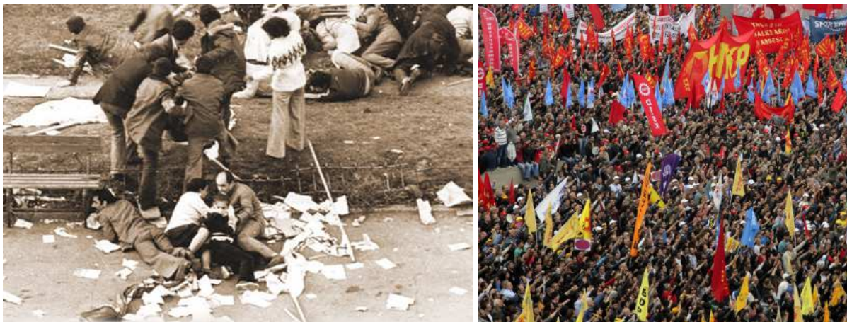
(Li: Massaker am 1. Mai 1977 auf dem Taksim-Platz in Istanbul. Re: 1. Mai 2011: Gedenkveranstaltung auf dem Taksim-Platz mit 200 000 Menschen.)

Die Bedenken Ecevits waren jedoch sehr wohl begründet, denn die Konter-Guerilla beteiligte sich tatsächlich an inländischem Terrorismus. 1977 ereignete sich ein schreckliches Massaker. Während der Terrorjahre der 70er-Jahre hatten die großen Gewerkschaften der Türkei am traditionellen Tag der Arbeit am 1. Mai einen Protestmarsch zum größten Platz Istanbuls, dem Taksim-Platz , organisiert. 1976 hatten sich wegen des zunehmenden inländischen Terrors 100 000 Menschen zu einer friedlichen Demonstration versammelt. Und im Jahr 1977 waren mindestens 500 000 Menschen auf dem Platz versammelt. Der Schrecken begann gegen Sonnenuntergang, als Scharfschützen auf den Dächern der den Platz umgebenden Häuser auf die Rednertribüne feuerten. Die Menge geriet in Panik. 38 Menschen wurden getötet, Hunderte wurden verletzt. Das Schießen dauerte 20 Minuten lang, und dennoch schritten mehrere Tausend anwesende Polizisten nicht dagegen ein.