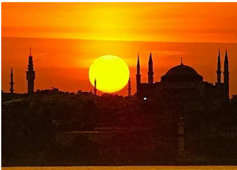
(Sonnenuntergang, Hagia Sophia, Istanbul, Türkei)