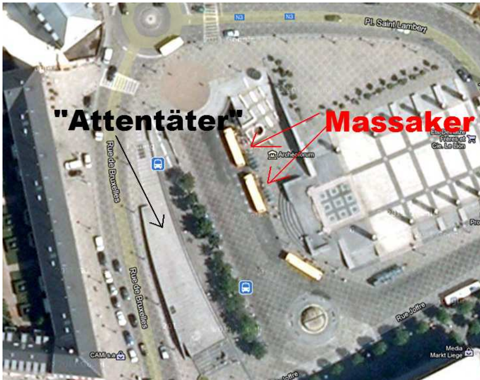
(Frühere Aufnahme des Place Saint Lambert)

Die Stelle, wo der „Attentäter“ – davon ist auszugehen – ermordet wurde, befindet sich gegenüber besagter Bushaltestelle auf dem Place Saint Lambert , wo das gestrige Massakers stattfand: