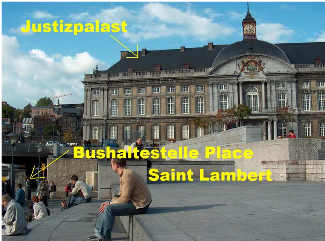
(Frühere Aufnahme des Place Saint Lambert)

Ist es nicht merkwürdig, dass die Passanten, die um ihr Leben rennen, unter eine Polizeiabsperrung (blauweißes Band, vgl. o.) schlüpfen müssen? (Video 3 , s.u.) – Die Polizei hatte das ganze Viertel schon abgesperrt , als sich die Menschen noch vor der Gefahr in Sicherheit brachten!