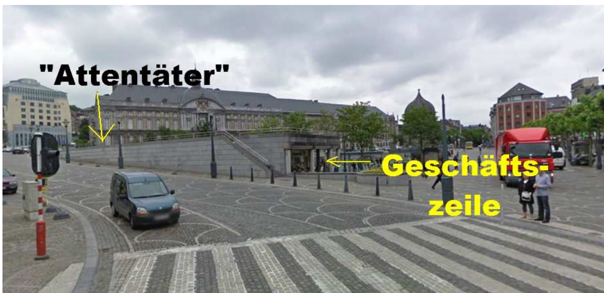
(Frühere Aufnahme des Place Saint Lambert)