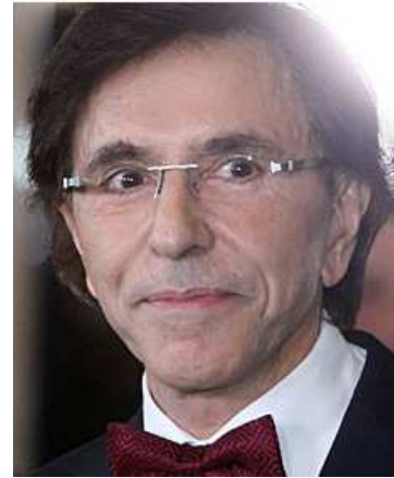
(Elio di Rupo, Jahrgang 1951)

Wahrscheinlicher ist, dass drei kleinere Sprengkörper (ferngesteuert) zur Explosion gebracht wurden und dann die Menschen von den Dächern aus unter Beschuß genommen wurden (siehe Bild u. 22 ).