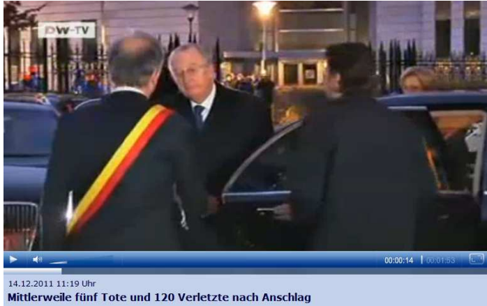
(König Albert II. 21 in der Mitte)

Am Nikolaustag 2011 war die Ernennung Di Rupos und am Luciatag (13. Dezember) der „Amoklauf“ auf dem Platz des Heiligen Lambert in Lüttich. Letzterer soll nach der Legende ... als junger Diakon um den Weihrauch zu entzünden, glühende Kohlen im Chorhemd (getragen haben), ohne dass dieses verbrannte ... 20 – ein „Bild“ für die Handgranaten, die an der Bushaltestelle explodiert sein sollen?