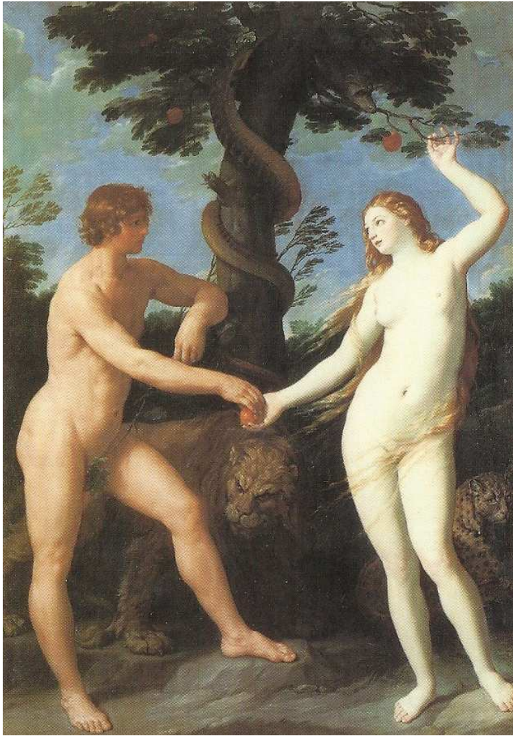
(Guido Reni, Adam und Eva im Paradies, Dijon)

Bildern der Genesis tut, auf jenen Zustand, da der Mensch in anderer Art zu seinen geistigen Welten gestanden hat als später. Aber nun tritt das Eigentümliche auf, durch das sich der Mensch in einer ganz anderen Weise innerhalb des Christentums zur Welt stellt, als es im Buddhismus 4 der Fall ist. Da kann als christlich die Idee bezeichnet werden: In mir lebt eine Weisheit durch jene Seelenverfassung, die ich jetzt habe. Durch die Art und Weise, wie ich die Sinneswelt beobachte und mit meinem Verstande zusammenfasse, lebt in mir eine Weisheit, eine Wissenschaft, eine Lebenspraxis.