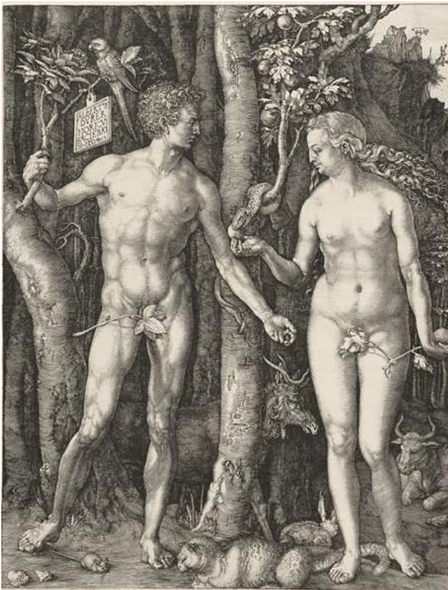
(Albrecht Dürer, Adam und Eva)

Wir haben es also nicht bloß mit einem einfachen Herunterstieg wie im Buddhismus zu tun, sondern mit einem sich verändernden Fühlen in diesem Heruntersteigen, das, wenn bloß die vorherigen Bedingungen gewirkt hätten, nicht so geworden wäre, wie es jetzt geworden ist: denn jetzt ist es so geworden, daß die Seelenverfassung der Menschen einer Versuchung verfallen ist.