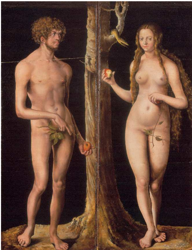
(Lukas Cranach d.Ä., Adam und Eva)

Sinnesschein, hinter die Illusion in das wahre Sein und würde überall imstande sein, das Richtige zu finden. Da ich aber in einer anderen Weise heruntergestiegen bin, als es den vorherigen Bedingungen entsprach, so habe ich durch mich diese Welt zu einer Illusion gemacht. – Woran liegt es, daß diese Welt eine Illusion ist? fragt der Buddhist . Er antwortet: Es liegt an der Welt! – Woran liegt es, daß diese Welt eine Illusion ist? fragt der Christ . Er antwortet: Es liegt an mir! Ich selber, mein Erkenntnisvermögen, meine ganze Seelenverfassung haben mich so in die Welt hineingestellt, daß ich jetzt nicht das Ursprüngliche sehe, daß jetzt nicht die Folgen meiner Taten so auftreten, daß alles fruchtbringend ist oder leicht entstehen könnte. Ich bin es selber, der die Welt mit dem Schleier der Illusion überzogen hat. – So darf der Buddhist sagen: Die Welt ist die große Illusion, also muß ich die Welt überwinden! So darf der Christ sagen: Ich bin in die Welt hineingestellt und muß dort mein Ziel finden.