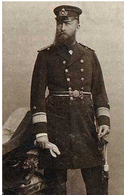
(Li: Alfred von Tirpitz beim Verlassen des Reichsmarineamts. Re: der junge Alfred von Tirpitz)

(Rolf Kosiek 2 ;) ... Der junge Alfred von Tirpitz (1849-1930), damals noch als Leutnant erster Offizier auf dem Kanonenboot >Blitz<, schrieb in einem Brief vom 27. 6. 1872 an seine Eltern, 3 aber auch 1919 in seinen Erinnerungen, von den Schwierigkeiten, denen sein Schiff