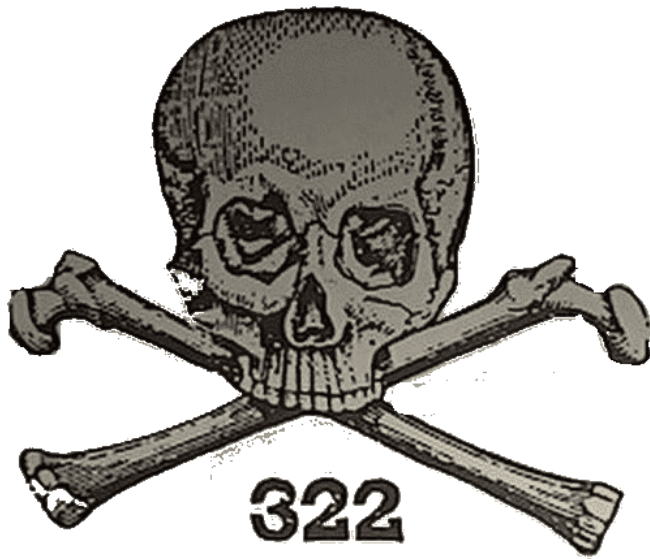
(Logo der Scull & Bones -Logen-„Bruderschaft“)