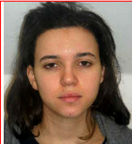
Hayat Boumedienne (26. 6. 1988)

Es folgt ein Nachtrag zur Artikelserie Gladio-Terror in Paris? 2 : Was geschah mit Hayat Boumedienne?