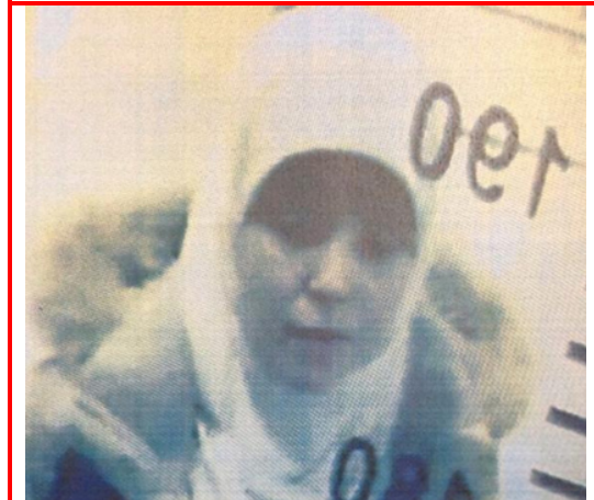
Aufnahme der Überwachungskamera: Das soll (!) Hayat Boumedienne bei der Passkontrolle auf dem Flughafen in Istanbul sein. 7 ("Wer's glaubt, wird selig.")

Es fällt doch auf, daß am 9. 1. 2015 die türkischen Behörden sagten, daß sie " keine Informationen " über Hayat Boumedienne hätten (was glaubhaft ist). Zwei Tage später behaupten dieselben Behörden, sie hätten umfangreiche Informationen über die Französin. D.h.: den türkischen Behörden wurden offizielle ( Falsch- ) Informationen zugesteckt, die sie zu veröffentlichen hatten.