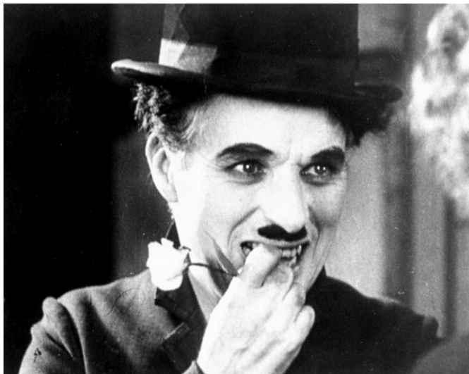
( Charlie Chaplin , 1889-1977)

Am berühmtesten ist wohl der britische Komiker Charles Spencer Chaplin , alias Charlie Chaplin (s.u.).