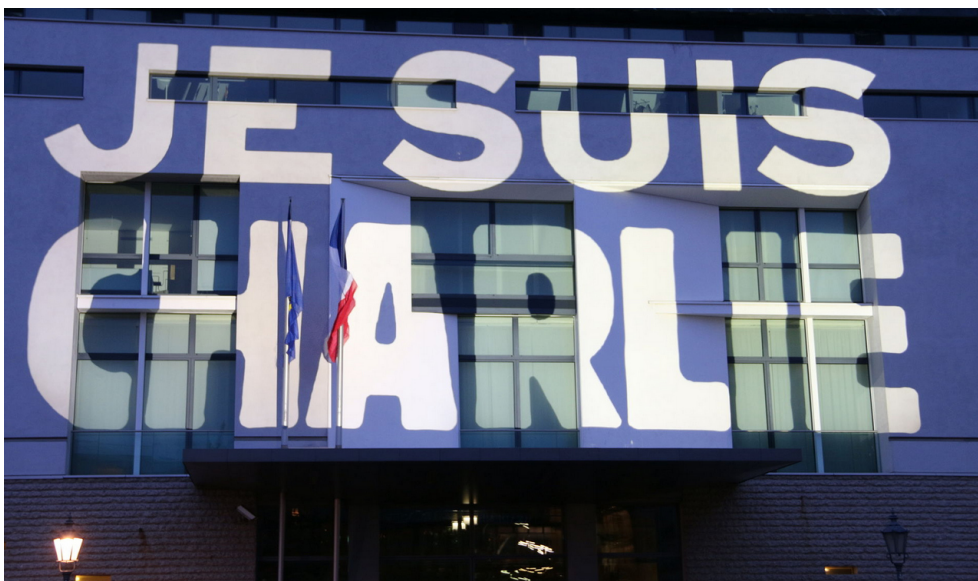
( Je suis Charlie - Schriftzug an der französischen Botschaft in Berlin am 11. Januar 2015 21 )

Zur Je-suis-Charlie -Manie: 20 Innerhalb kürzester Zeit ging nach dem Massaker in der Charlie-Hebdo -Redaktion (7. 1. 2015) ein neuer Slogan um die Welt: