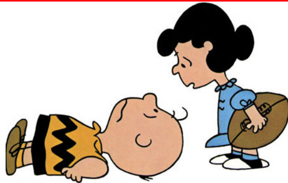
(Li: Charlie Brown )

Die Peanuts 23 -Hauptfigur Charlie Brown ... ist ein ewiger Verlierer und Pechvogel ... das Opfer von bösen Streichen aller Mädchen ... ein ernsthaftes, unglückliches Kind 24 – eine Tragik-komische Gestalt.