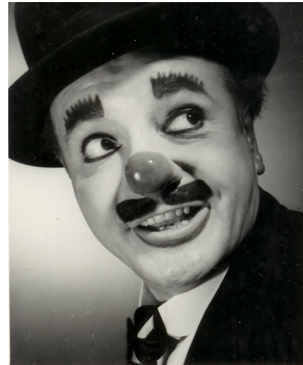
( Charlie Cairoli , 1910-1980)

Wenn nun "alle Welt" Schilder mit einer Je-suis-Charlie -Aufschrift (– interessanterweise nicht die Politiker 25 –) hochhebt (s.u.), dann scheint doch ein Programm abzulaufen, mit dem die Logen-"Brüder" im Hintergrund austesten konnten, wie schnell und in welchem Ausmaß