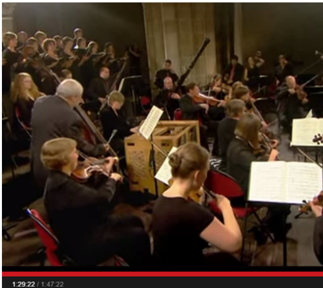
Bach: Mass in B minor, BWV 232 | Akademie für Alte Musik Berlin 1

J. S. Bach: das "Osanna" aus der "h-Moll-Messe", BWV 232 (SE-20)