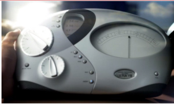
Der E-Meter (aus dem Scientology-Werbevideo, s.o.)