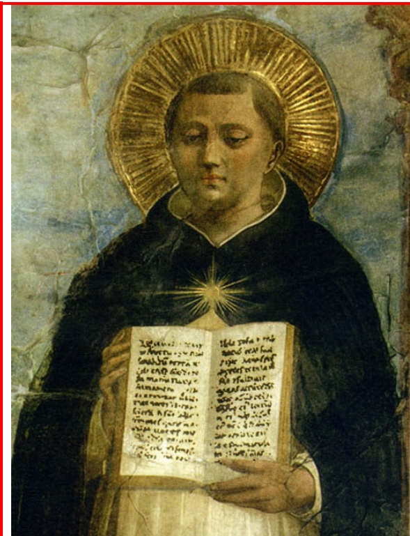
Thomas von Aquino (um 1225-1274)

Thomas von Aquino (II) – J. S. Bach: "So löschet im Eifer der rächende Richter", BWV 90 (SE-23)