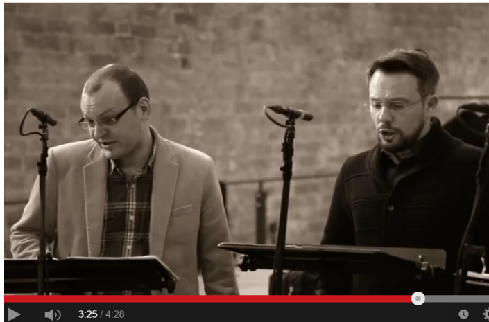
CALMUS - Ach wie flüchtig, ach wie nichtig BWV 644, BWV 26 9

Der Eingangssatz folgt der von Bach in den Choralkantaten bevorzugten Anlage: Eingebettet in einen eigenthematischen Orchestersatz, wird der Choral zeilenweise vom Sopran