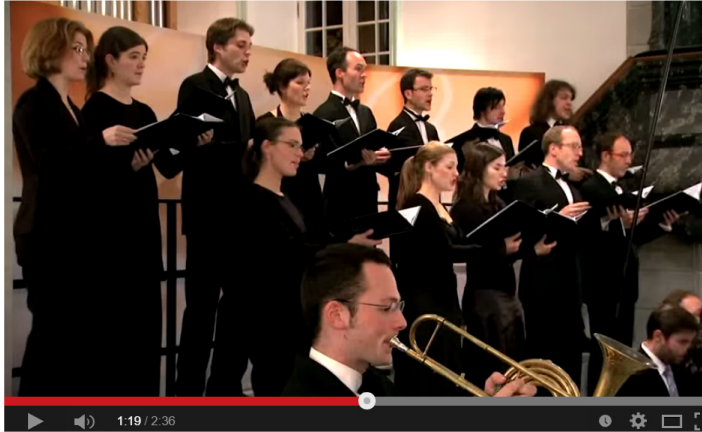
J.S. Bach - Cantata BWV 26 - Ach wie flüchtig, ach wie nichtig - 1-Chorus (J. S. Bach Foundation) 7

Und: 5 Mit Thomas von Aquino hebt eine philosophisch gesunde Vorstellungsart an, die den Aristotelismus 6 in einer neuen Form aufleben läßt.