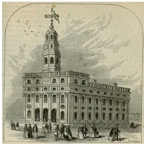
(Der ursprünglich errichtete Nauvoo-Tempel)