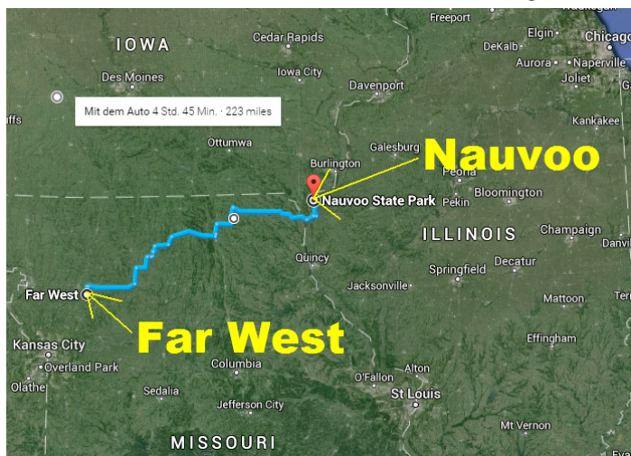
(Von Far West bis Nauvoo sind es ca. 350 km.)

Ich fahre mit der Mormonen-Geschichte fort: 2 Durch Gegner der Kirche aufgehetzt, erließ Gouverneur Lilburn Boggs 1838 einen (zu verurteilenden) Ausrottungsbefehl, der besagte, die „Mormonen müssen aus dem Staat vertrieben oder vernichtet werden.“ Noch 1839 wurde in Far West ein weiterer Tempelbauplatz eingeweiht. Zu einem Bau kam es jedoch nicht mehr. Pläne zur Errichtung von Städten Zions blieben wegen der Verfolgung und des folgenden Wegzugs in den Anfängen stecken. Die Flüchtlinge wurden in Illinois aufgenommen und gründeten dort als neuen Anfang am Ufer des Mississippi am Ort Commerce die Stadt, die sie dann Nauvoo (s.u.) nannten. Von dort aus begann das Missionswerk 3 in alle Welt, besonders