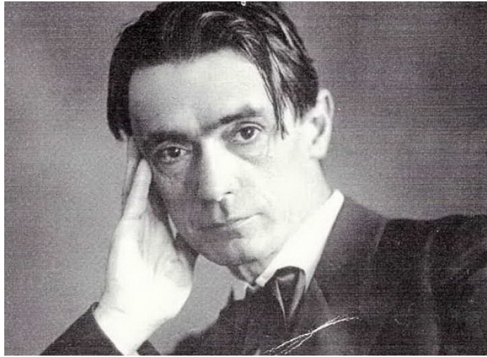
(Rudolf Steiner, 27. 2. 1861 - 30. 3. 1925)

Ein Grunddogma , das so mehr oder weniger unbewußt wirkt, ist eben: