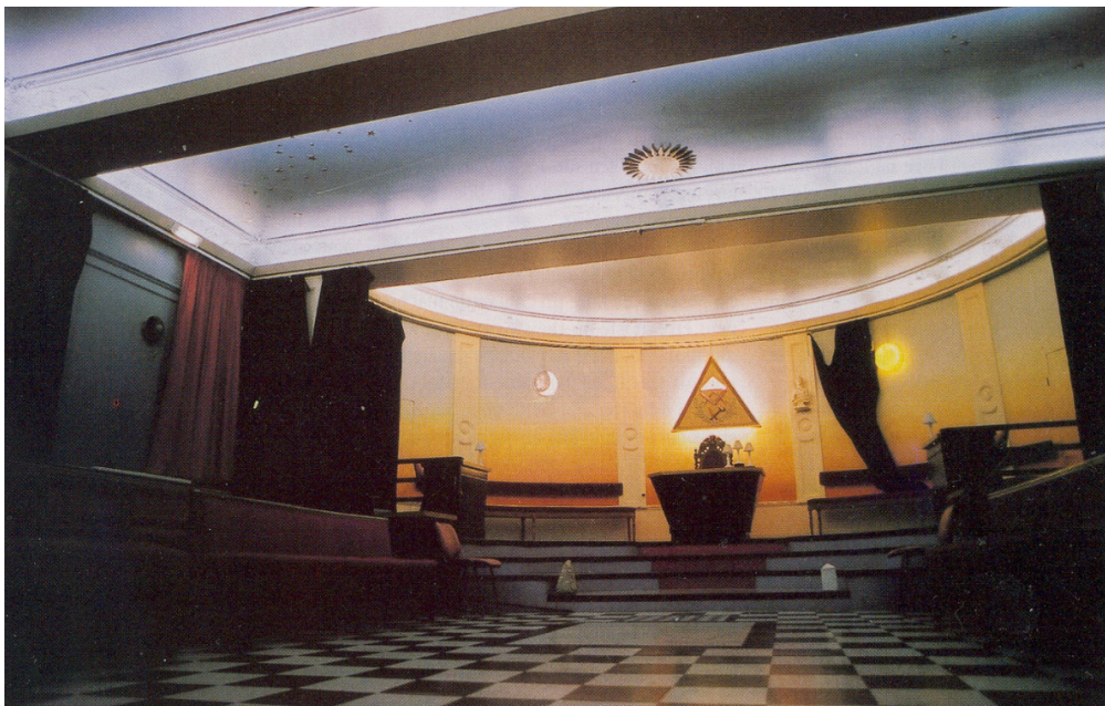
(Pariser Loge Grand Orient de France )

Dieses (deutsch-)mitteleuropäische Wissen kommt nicht in Betracht für die fünfte nachatlantische Kultur (seit 1413), darf nicht in Betracht kommen. Es muß alles so eingerichtet werden, daß die fünfte nachatlantische Kultur angelsächsische Physiognomie trägt. Daher muß eine Art von Ehe zwischen Westeuropa und Osteuropa 11 eben mit Vernachlässigung des (deutsch-)mitteleuropäischen Leben herbeigeführt werden. – In solchen okkulten Orden sprach man seit vielen, vielen Jahren von jenem Krieg, in dem wir jetzt leben . 12