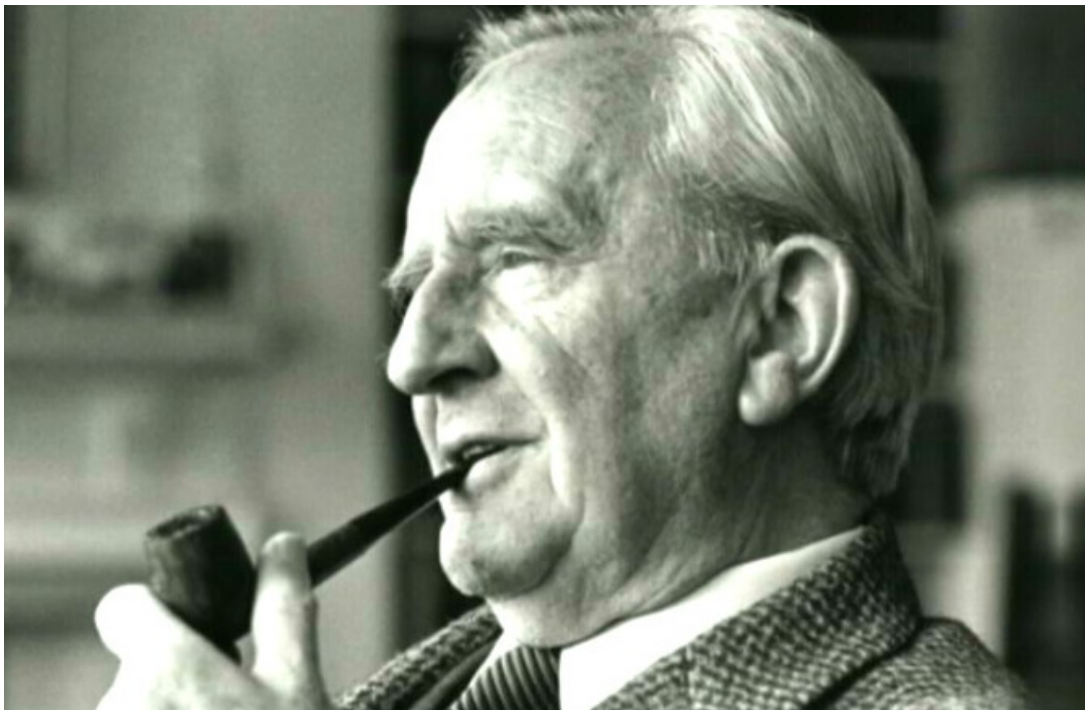
(John Ronald Reuel Tolkien, 2 1892-1973)

Ich fahre nun mit dem Thema fort, das ich am 7. Juni 2015 im Seminar begonnen habe: 1 Tolkiens "Herr der Ringe" – aus anthroposophischer Sicht.