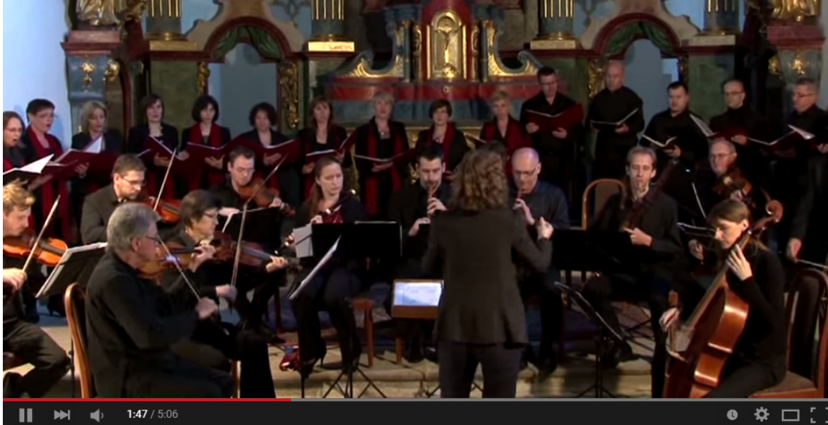
Johann Sebastian Bach, Cantata BWV 194, ouverture-chorus: Hochsterwünschtes Freudenfest 17

Höchsterwünschtes Freudenfest (BWV 194, Höchsterwünschtes Freudenfest , 1. Chor, Uraufführung: 2. 11. 1823, Anlass: Einweihung der Kirche und Orgel in Störmthal, südl. von Leipzig, Text: unbekannt)