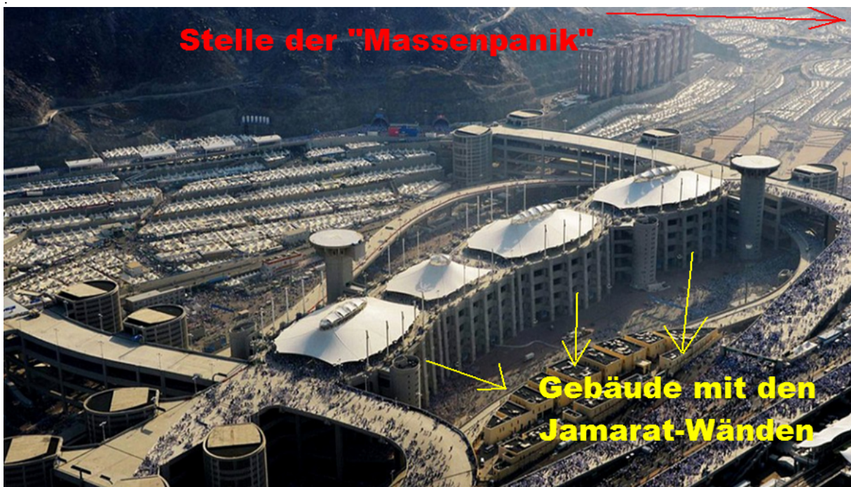
(Unter Bild 8 35 steht, daß die "Massenpanik" ungefähr um 9 Uhr morgens begann.)