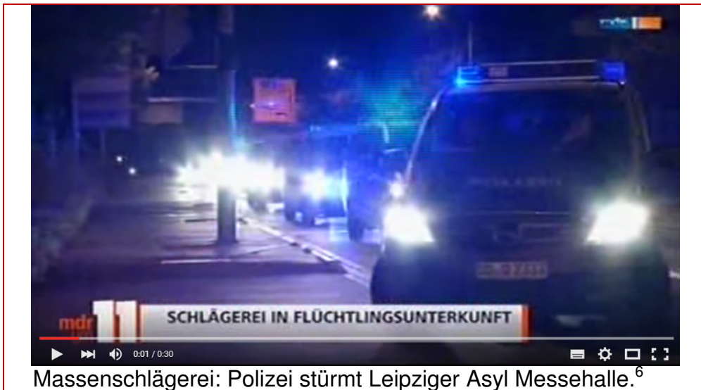
Massenschlägerei: Polizei stürmt Leipziger Asyl Messehalle. 6

Leipzig – Großeinsatz für die Leipziger Polizei in der Neuen Messe! Nach einer Massenschlägerei in Halle 4 konnten die Beamten erst mit einem Großaufgebot (40 Fahrzeuge) die Situation unter Kontrolle bekommen.