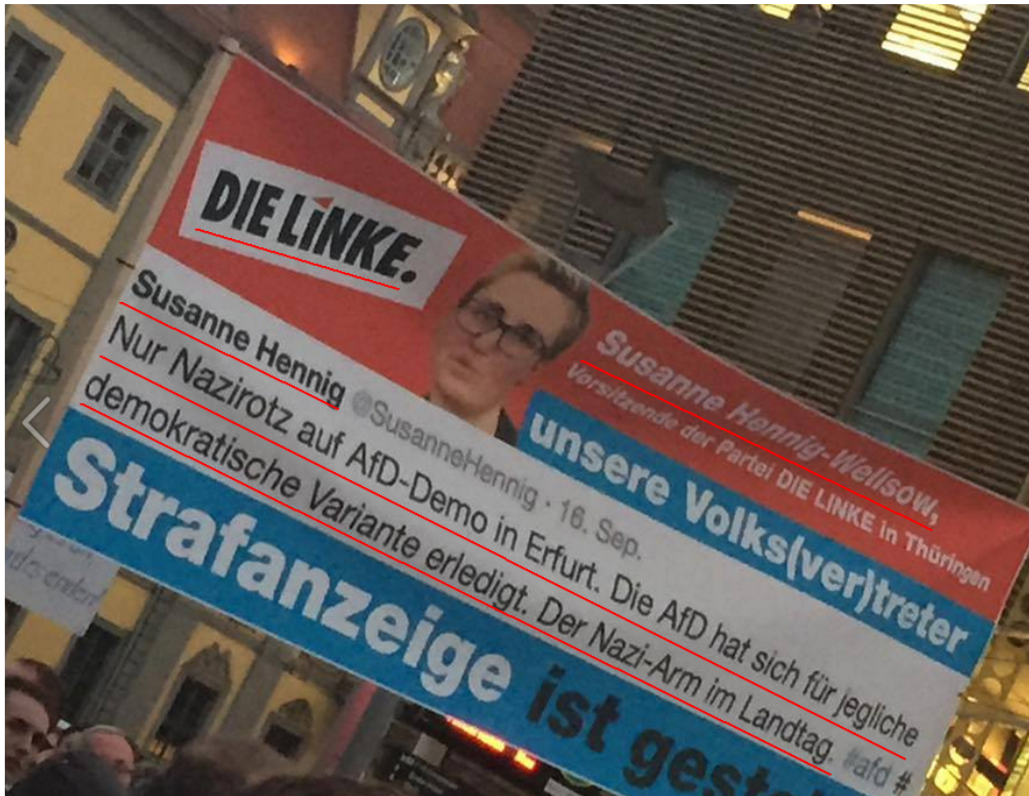
(Zum Transparent, AFD-Demo in Erfurt, 23. 9. 2015: 13 die "Anti-Anti-These" zur "Anti-These" [s.o.]

Dieser gewollte Protest wird wahrscheinlich immer mehr zunehmen, auch in anderen Städten. Nachfolgende Meldungen dürften die Protest-Welle anschwellen lassen: " man " 14 will offensichtlich provozieren: 15