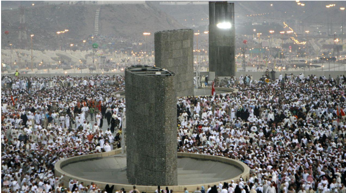
(Die 3 Jamarat-Wände im Bau 32 – noch nicht überdacht.)

Menschen vor und wieder zurückgedrängt worden.