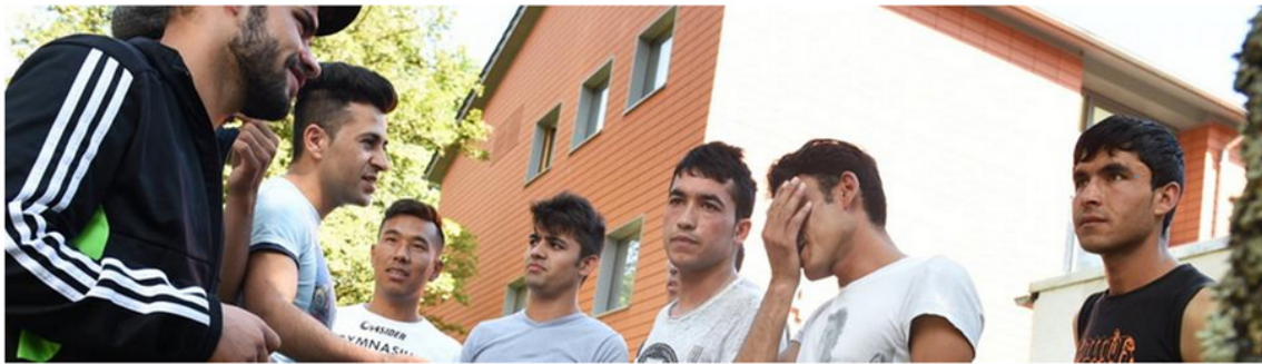
Unterbringung von Flüchtlingen

Man beachte bei diesem Bild (s.u.), 21 daß ausschließlich junge Männer 22 gezeigt werden, nicht , wie sonst üblich Familien mit Kinder :