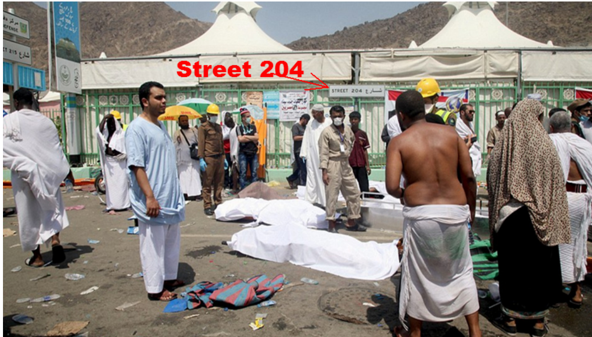
(Die Örtlichkeit der "Massenpanik" mit zugedeckten, noch nicht abtransportierten Leichen, ist unversehrt. Auch ist kein Blut zu sehen.)