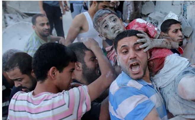
(Gaza, Folgen des israelischen Bombenterrors, 2009 [li 15 ], und 2014 [re 16 ])