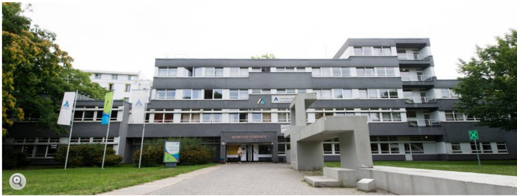
Jugendherberge Berlin International: Reaktion auf den Bedarf der Kommunen

Das Jugendherbergswerk reagiert auf die Wohnungsnot bei Flüchtlingen. Ab Oktober wollen die ersten Häuser ihre Zimmer Zuwanderern zur Verfügung stellen. In einem ersten Durchgang sollen 3800 Menschen bedacht werden.