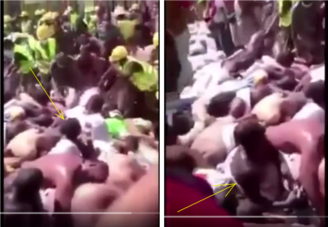
COMPILATION MECCA STAMPEDE - Zusammenstellung Mekka Stampede -Compilation La Mecque Stampede 24

Nun gibt es ein paar Videos, bzw. Bilder, mit deren Hilfe man Rückschlüsse ziehen kann, was tatsächlich geschah. Innerhalb des Leichen-"Knäuels" – alle sind ohne äußere Verletzungen – machen sich Personen, die überlebt haben (siehe Pfeile), den Helfern bemerkbar: