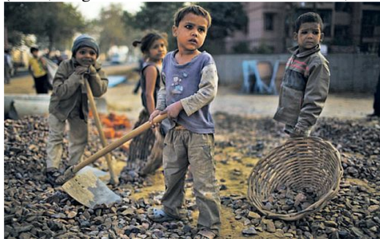
(Kinderarbeit in Indien 17 )