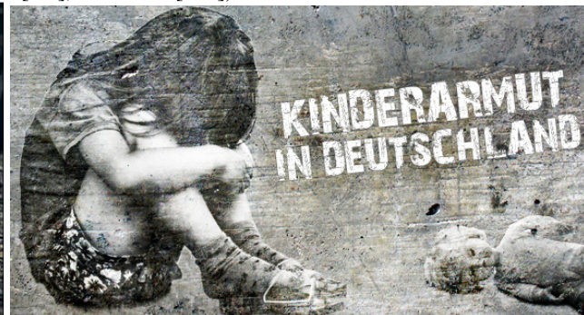
( http://www.spiegel.tv/filme/kinderarmut-extra/ )