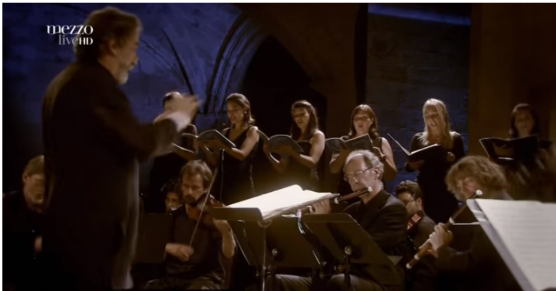
Bach: Mass in B minor, BWV 232 | Jordi Savall 24

Ein weiteres "Schlüsselerlebnis" (SE-142) in der Ausnahmemusik Johann Sebastian Bachs ist: Cum Sancto Spiritu (BWV 232, H-moll-Messe , 11. Chor [48:28-52:21], 1724-1749, Uraufführung der gesamten Messe 1834/35?)