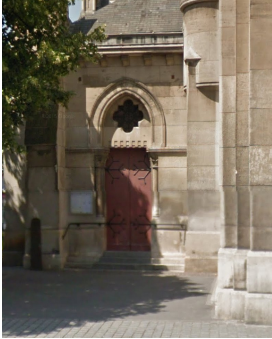
(St. Denys de L'Estrée)