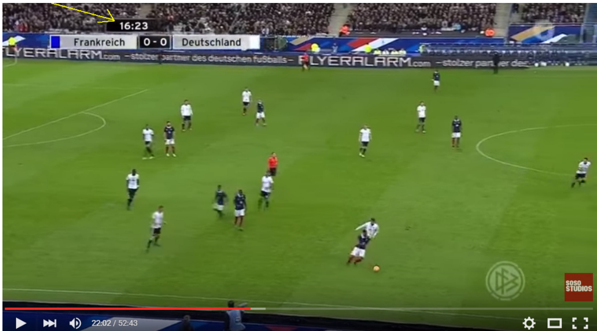
France vs Germany 2-0 FIRST HALF TIME | BOMB EXPLOSION SOUND OUTSIDE STADE DE FRANCE | #Prayforparis 2

Bei den Explosionen um das Stadion – wohlgermerkt: die im Stadion zu hören waren – fanden in der 17. und 20. Spielminute statt, genau um 16:23 und 19:34 (s.u.):