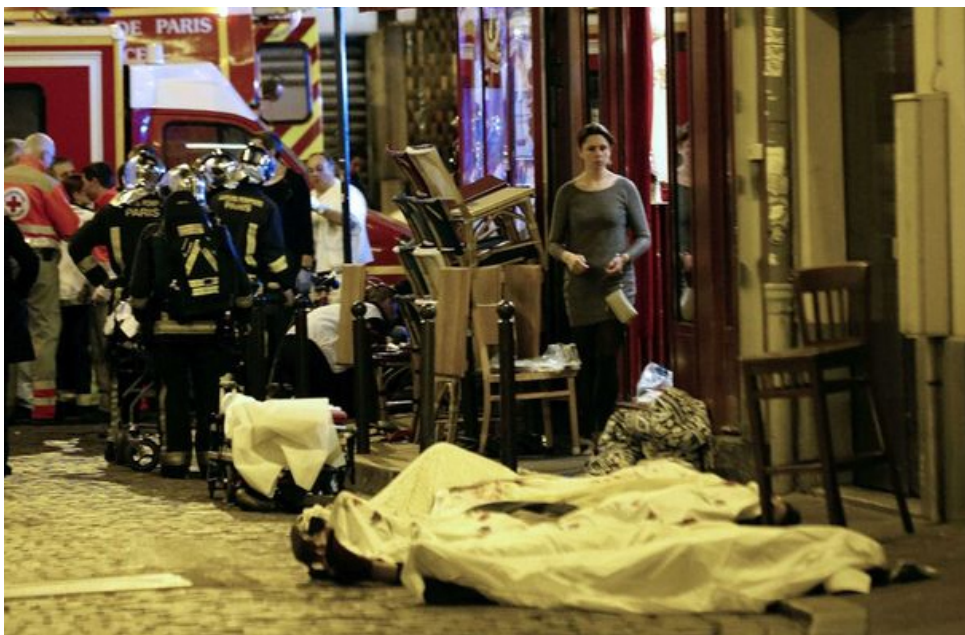
(Möglicherweise handelt es sich bei diesen Leichen um diejenigen vor La Belle Équipe )

Sie sahen aus wie Soldaten oder Söldner und das ganze Geschehen sah aus wie eine militärische Operation. Es war klar, dass beide schwer bewaffnet waren und der Schütze trug mehrere Magazine bei sich. Beide setzten sich dann cool wieder in den Wagen und rasten in Richtung Bataclan-Theater.