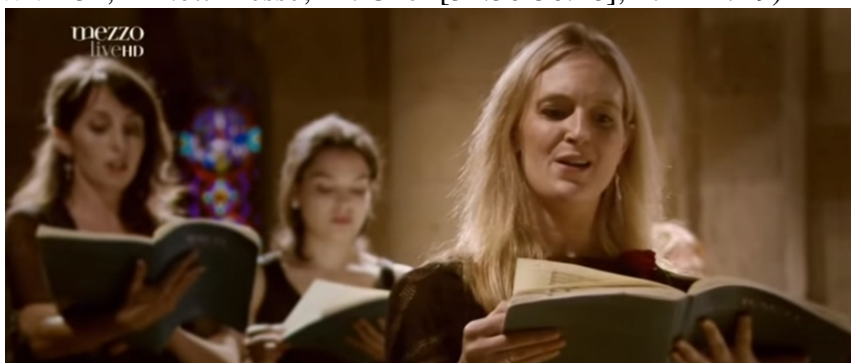
Bach: Mass in B minor, BWV 232 | Jordi Savall 8

Ein weiteres "Schlüsselerlebnis" (SE-143) in der Ausnahmemusik Johann Sebastian Bachs ist: Credo (BWV 232, H-moll-Messe , 12. Chor [52:30-56:28], 1724-1749)