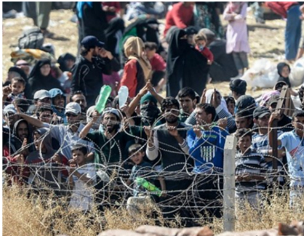
(Syrische Flüchtlinge an der türkischen Grenze. 8 )

Bekanntlich gehört die Türkei zu den Unterstützern von IS und Konsorten. 6 Sie ist also Mitverursacher der Flüchtlings- bzw. Migrationswelle.