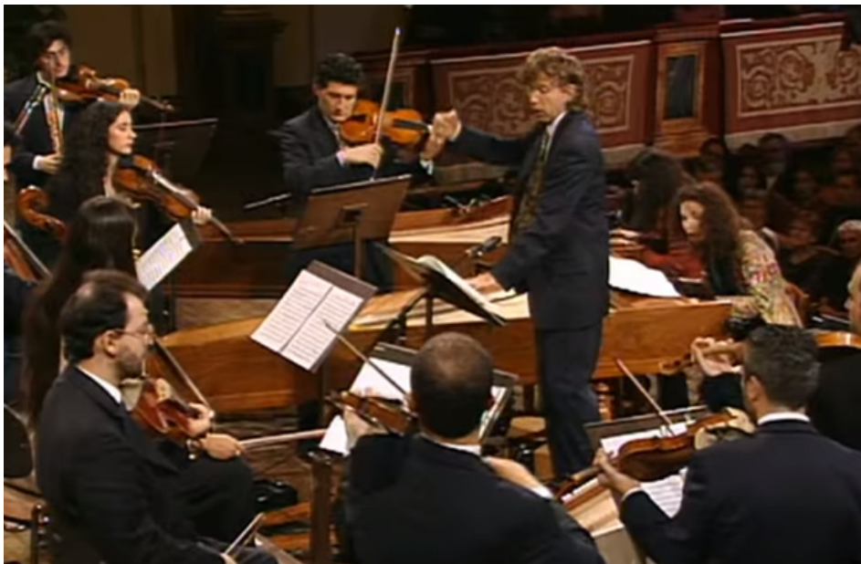
Bach: Concerto for three keyboards in D minor, BWV 1063 | Il Giardino Armonico 13

Ein weiteres "Schlüsselerlebnis" (SE-205) in der Ausnahmemusik Johann Sebastian Bachs ist das Konzert für drei Klaviere in d-Moll, BWV 1063: