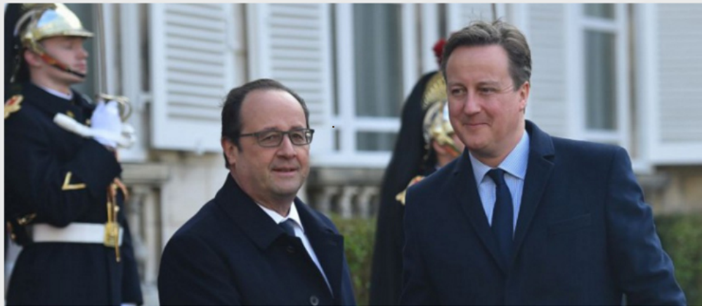
Präsident Hollande (l) und Premierminister Cameron: Wenn Berxit, dann Asylwelle