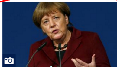
Merkel vor EU-Gipfel mit der Türkei

Am Montag findet ein weiterer EU-Krisengipfel zur Bewältigung der Flüchtlingskrise statt. Im Mittelpunkt stehen Gespräche mit der Türkei, um die Flüchtlingsroute über die Ägäis zu schließen. Doch eigentlich bräuchte es eine längerfristige Lösung. Von Tim Herden. | mehr