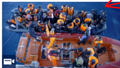
Vor dem EU-Türkei-Flüchtlingsgipfel