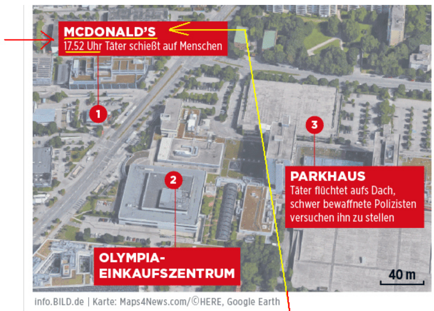
Bild.de behauptet (s.u. 1 ), daß der offizielle Täter, der 18-jährigen Deutsch-Iraner um 17:52 sowohl vor 2 (oder im) McDonald's , als auch im Olympia-Einkaufszentrum geschossen haben soll. Er wäre also zur gleichen Zeit an zwei Orten gewesen sein.