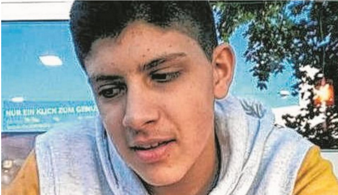
("Sündenbock" Ali David Sonboly 11 )

Auch die Tatsache, daß das Münchner Gladio-Massaker auf den 5. Jahrestag der Gladio-Anschläge in Norwegen mit dem "rechten Sündenbock" Anders Breivik 10 gelegt wurde, spricht für sich.