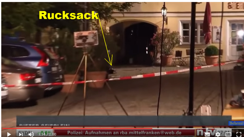
Terror Attack 3 in Ansbach Germany Selbstmordanschlag durch Asylanten am 24.07.2016 16