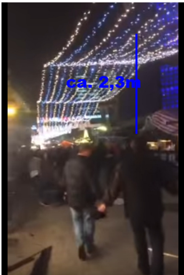
(Aus obigen Video)