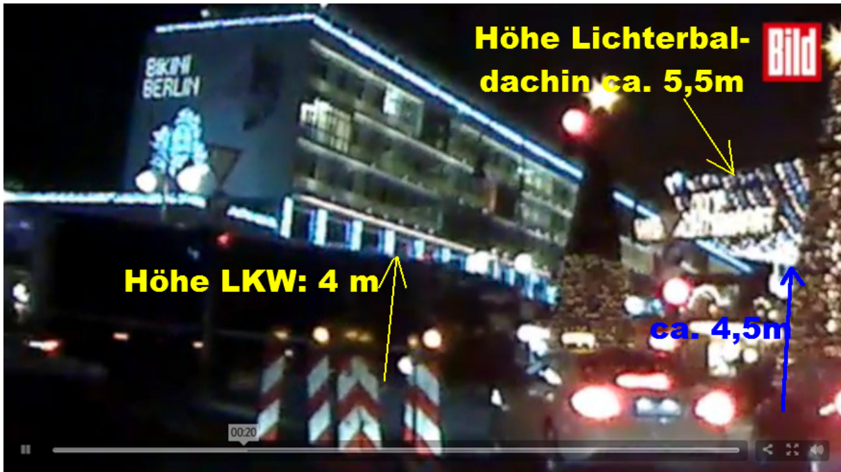
(Aus Artikel 2220, S. 3)