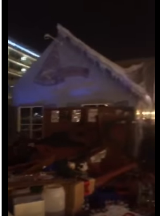
(Berg von kaputten Gegenständen ... aus denen wahrscheinlich besagte Kollegin gerettet wurde. 3 )