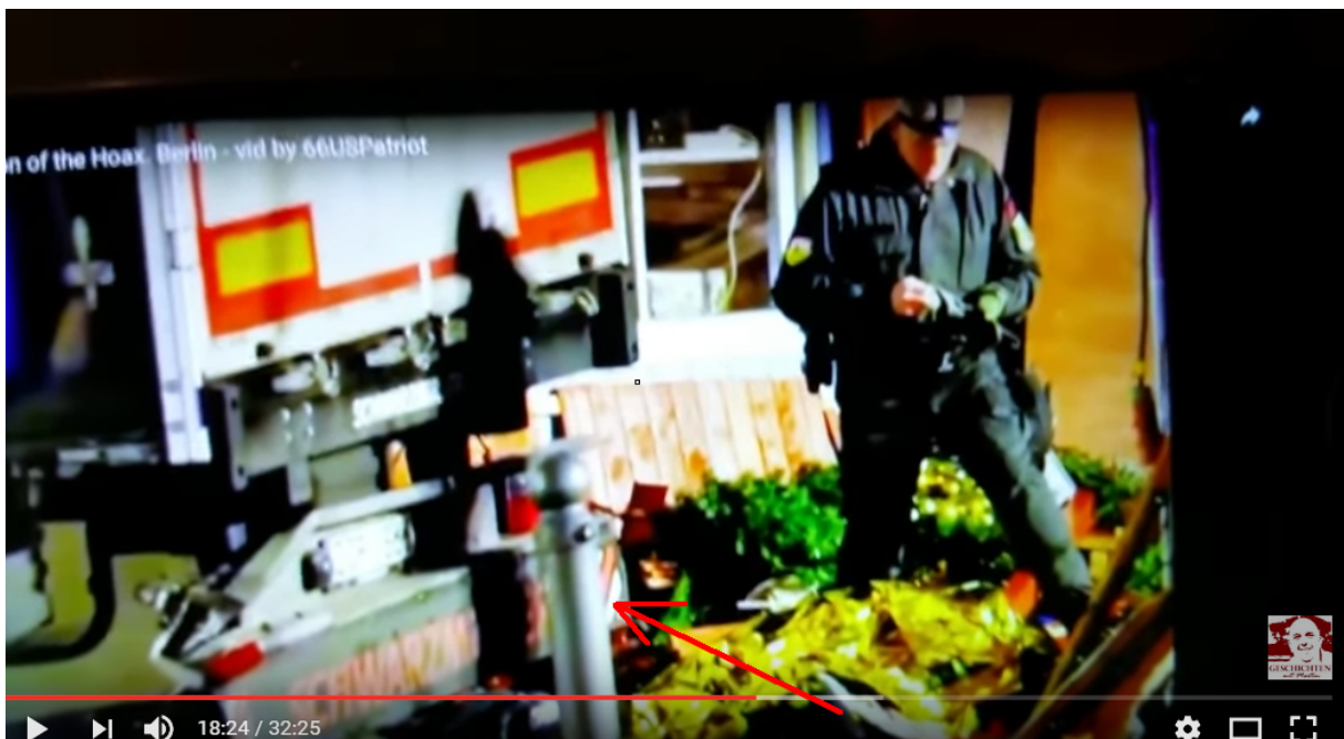
WEIHNACHTSMARKT DEBUNKED Berlin Breitscheidplatz live on Tape 30.12.16