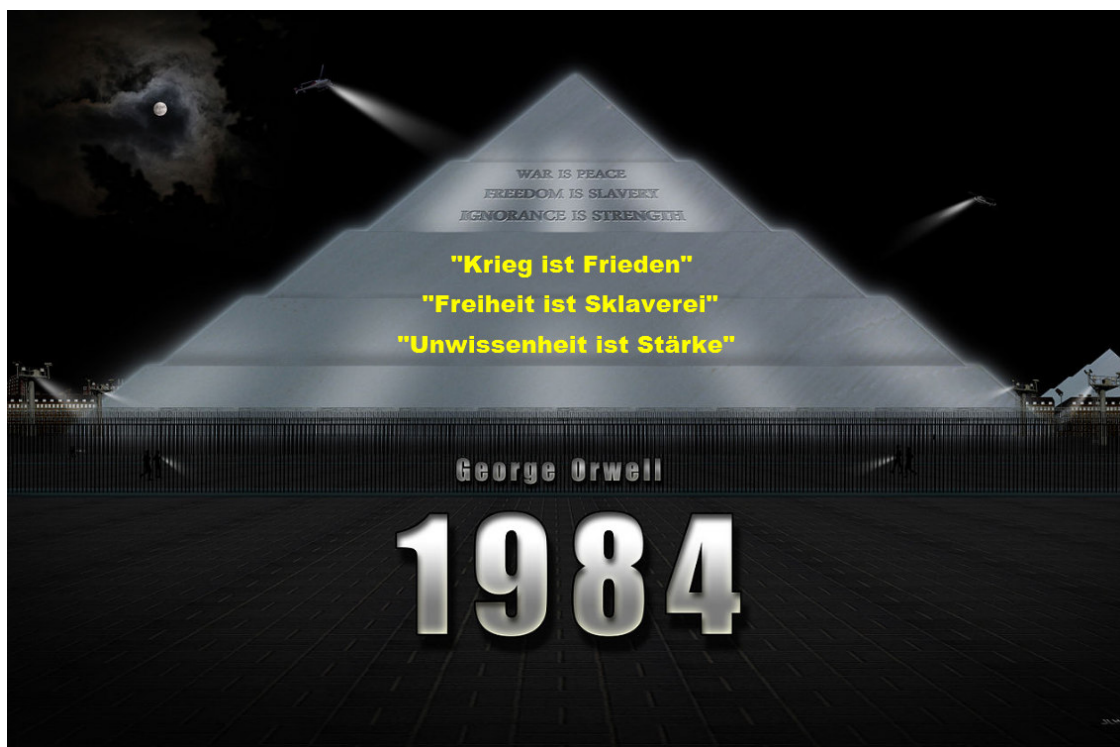
(Darstellung des „Ministeriums für Wahrheit“ [vgl.u.] in „1984“ nach Textangaben als Fotomontage. 2 )

"Mit dem geschichtlichen Zusammenhänge ist es so, dass für unseren gegenwärtigen Menschheitszyklus wir nicht verstehen können, wir nicht begreifen und richtig empfinden können ein Ereignis. ... Was die Generation, die vorher an der Geschichte mitgetan hat, für Impulse hineingeworfen hat in den Strom des geschichtlichen Werdens, das hat eine Lebenszeit von dreiunddreißig Jahren; dann ist sein Osteranfang, dann ist seine Auferstehung ... Zusammenhänge in Intervallen von dreiunddreißig zu dreiunddreißig Jahren, das ist dasjenige, was Verständnis bringt in dem fortlaufenden Strom des geschichtlichen Werdens." 1