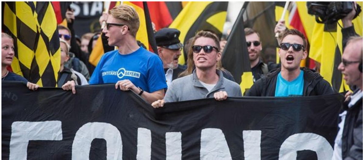
(Archivbild einer Demonstration von [angeblich] rechtsextremen "Identitären" in Berlin. 9 )