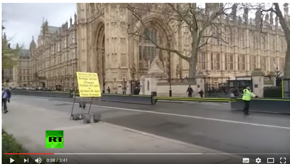
Go! Go Away!': First moments of police locking down Westminster following attack 2

Die Szene spielt sich ca. 200 Meter von der Westminster-Brücke ab – die "Amokfahrt" dort kann aus dieser Entfernung meines Erachtens nicht der Auslöser für das Wegrennen sein. Nun gibt es Videos, wo Polizisten die Menschen von dem Areal des Westminster-Parlaments wegtreiben, wie z.B.: