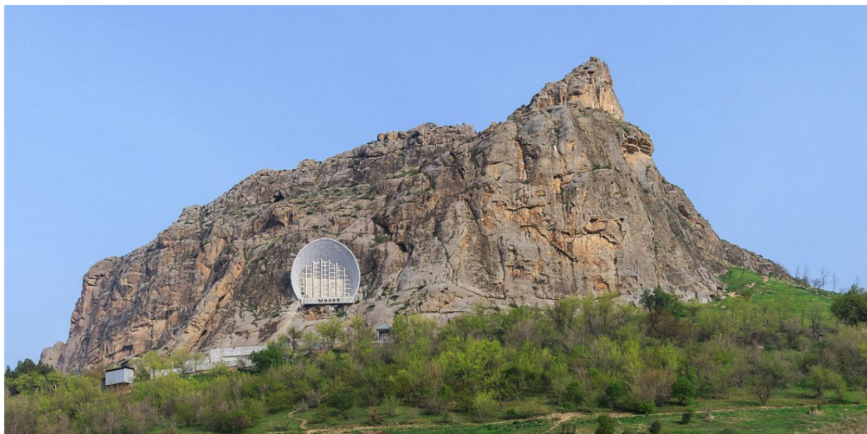
(Der Suleiman-Too mit dem Gebäude des Historischen Museums. 14 )

Neben dem, daß Osch ... einer der Hauptumschlagsplätze für Drogen in Asien ist, 12 befindet sich dort der heilige Berg der Kirgisen, der 1110 Meter Suleiman-Too (Thron des Salomo). Babur, der Nachkomme Timurs 13 und Begründer der indischen Moguldynastie, kam im nahe-