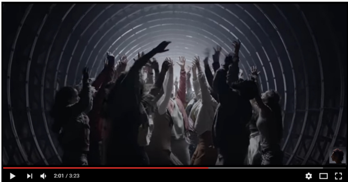
Jamala -1944 (Official Music Video) 20

In dem offiziellen Video ihres (sehr banalen) Siegersongs 1944 19 ist (u.a.) eine Tunnelröhre zu sehen, in der – man denke sich die Metro dazu – Menschen verzweifelt ihre Arme nach oben strecken (s.u.):