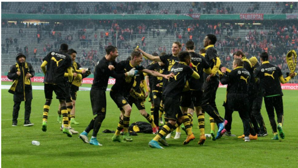
Dortmunds Sieger feiern nach dem 3:2-Sieg in der Allianz Arena mit den BVB-Fans