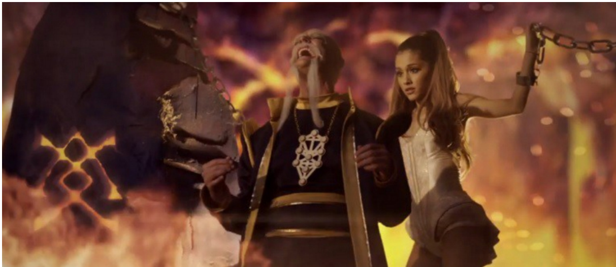
(Die unter Mind-Control stehende Ariana Grande 10 mit einigen satanistischen Symbolen. 11 )

Am 22. Mai hatte sich der Mann nach einem Konzert der Sängerin Ariana Grande (s.u.) in der Manchester Arena in die Luft gesprengt. 22 Menschen wurden getötet und Dutzende weitere verletzt, unter ihnen etliche Minderjährige. Der Täter kam ebenfalls ums Leben. 9 Kurz nach dem Anschlag hatte die Polizei erklärt, sie habe Mitglieder seines Netzwerks verhaftet.