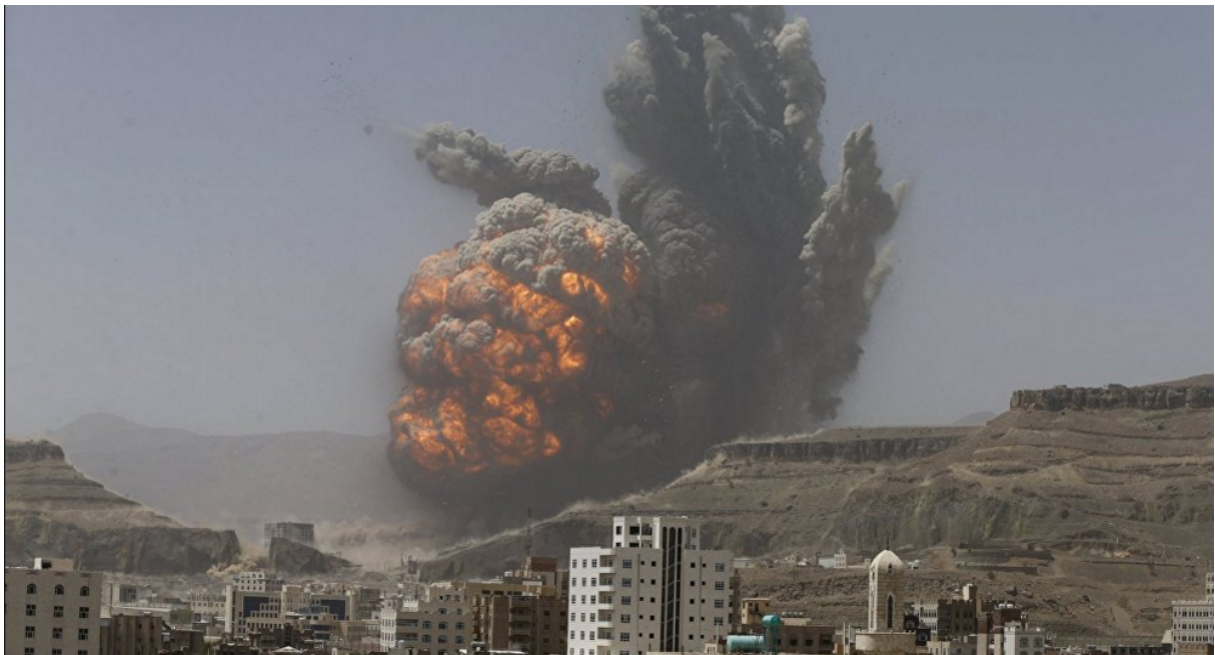
(Arabische Koalition fliegt Bombenangriffe in Jemen. 4 )

Ich fahre mit dem globalresearch -Artikel 2 fort: 3 Im vergangenen Monat (April 2017) war Premierminister Theresa May in Saudi-Arabien und verkaufte mehr von den britischen Waffen, die die Saudis gegen den Jemen einsetzen. Durch die Kontrollräume in Riyadh unterstützen britische Militärberater die saudischen Bombenangriffe, die mehr als 10.000 Zivilisten getötet haben. Es gibt jetzt deutliche Anzeichen von Hungersnot. Ein jemenitisches Kind stirbt alle 10 Minuten an vermeidbaren Krankheiten, sagt Unicef.