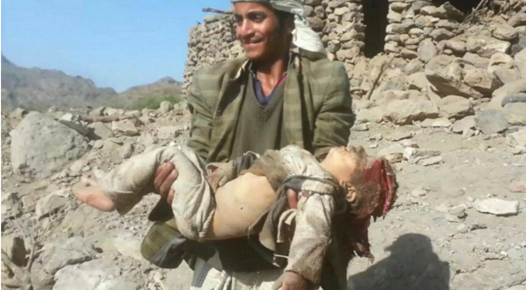
(Im Jemen läuft eine Katastrophe ab, die Saudi-Arabien mitzuverantworten hat. 6 )

So wie Blair nach Großbritannien die Gewalt von ihm und George W. Bushs blutgetränkte "Shit Show" nach Hause brachte, so verband David Cameron, unterstützt von Theresa May, sein Verbrechen in Libyen und seine schrecklichen Nachwirkungen, einschließlich der Getöteten und Verstümmelten in der Manchester-Arena vom 22. Mai.