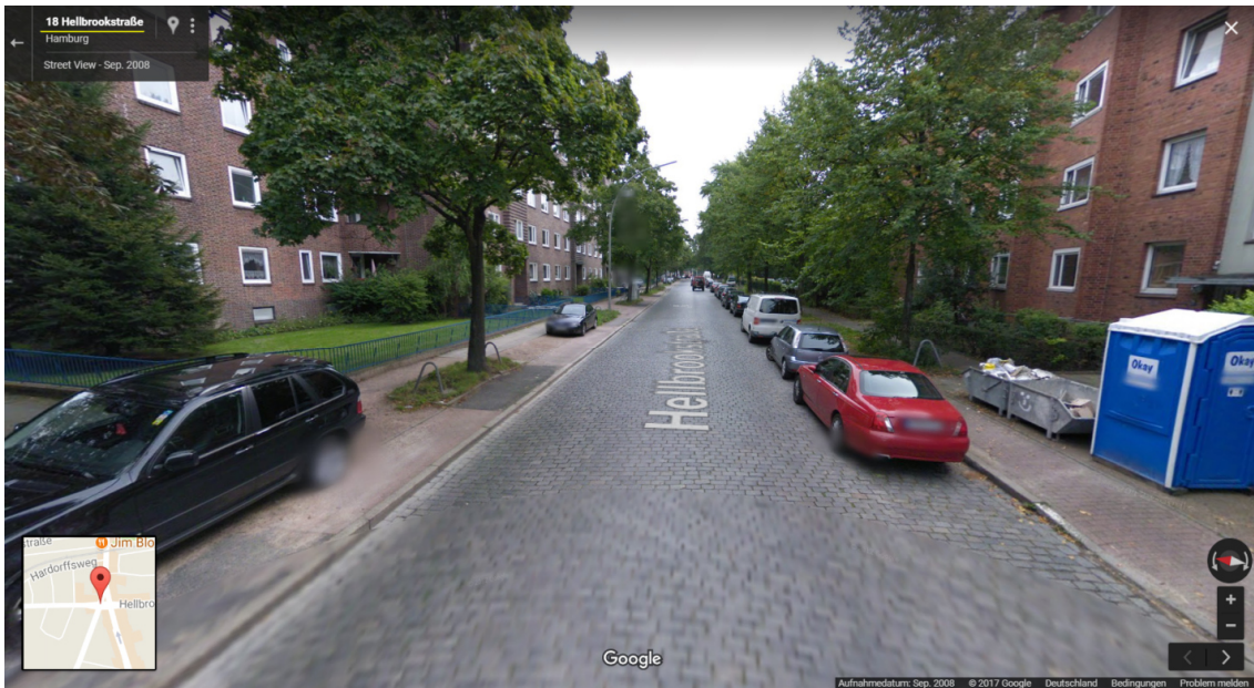
(Hellbrookstraße 18, Blick in Richtung Osten)