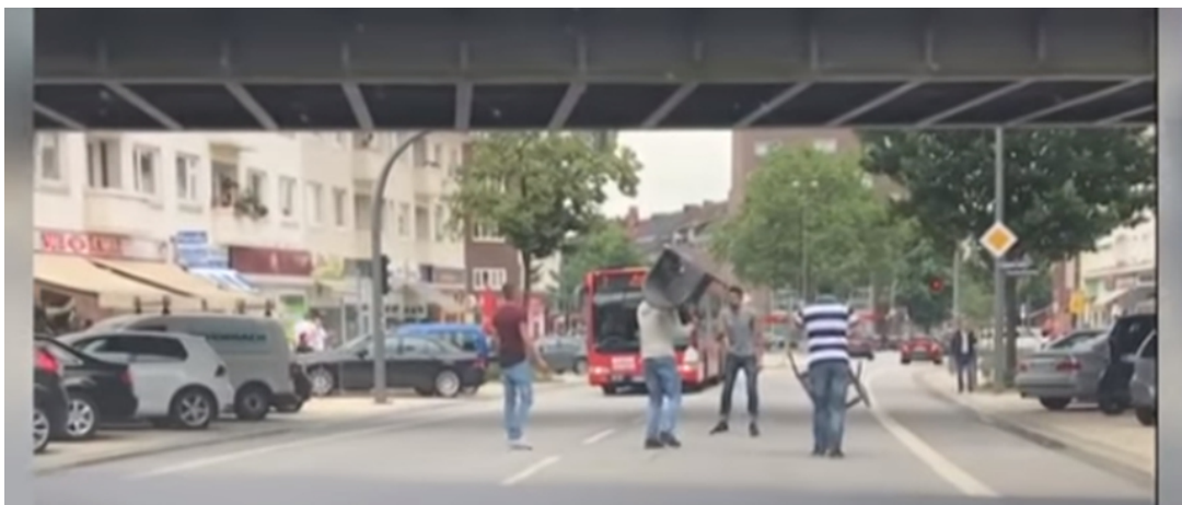
Hamburg: So haben Passanten den Supermarkt-Attentäter überwältigt 6