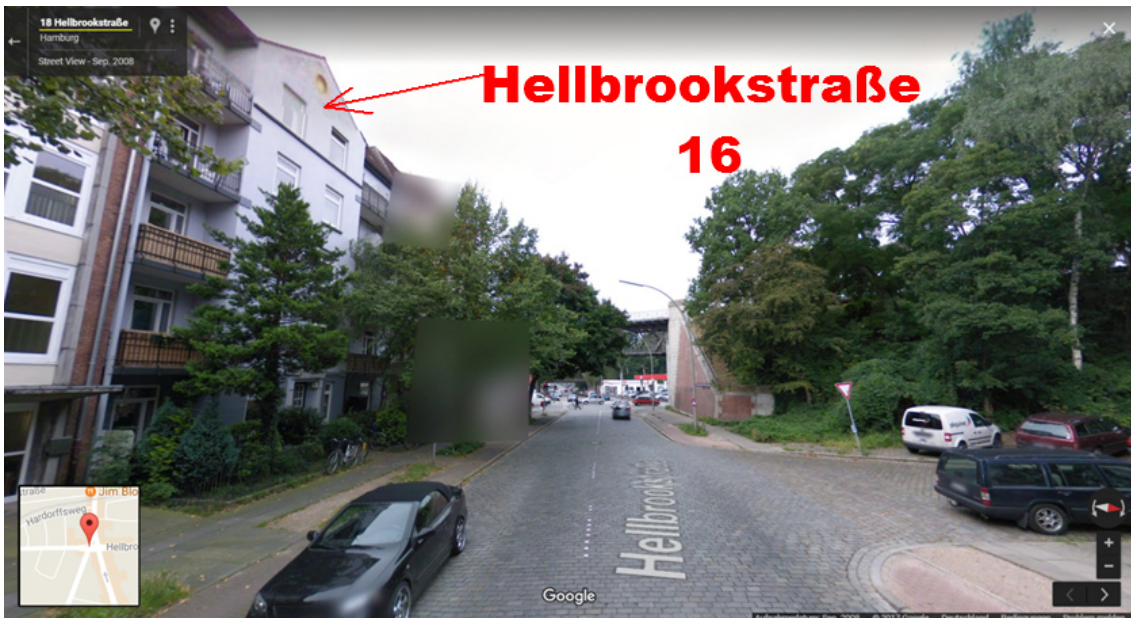
(Hellbrookstraße 18, Blick in Richtung Westen)